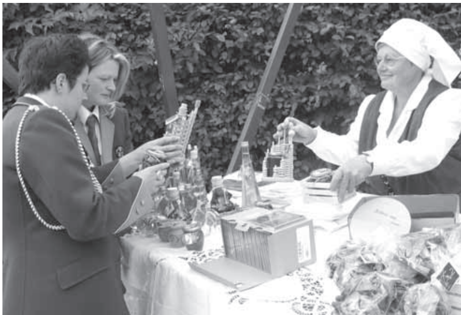
MED OBISKOM NA GRADEŽU

Letošnji obisk Švicarjev je sovpadal s praznovanjem občinskega praznika. Pri pripravi praznovanj so kot vedno z Občino Velike Lašče sodelovala različna društva. V imenu društva Kulturni most Lützelflüh–Velike Lašče se za pomoč pri pripravi programa za Švicarje lepo zahvaljujem Občini Velike Lašče in županu Antonu