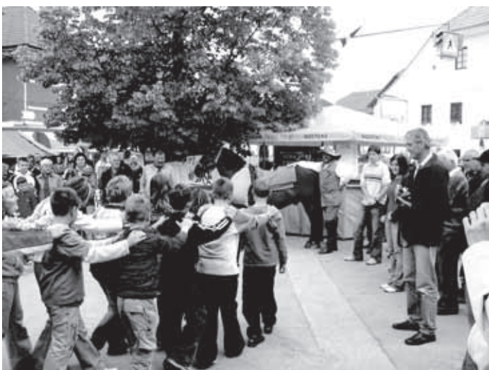
NA TRŠKEM DNEVU SO SE PREDSTAVILI MLADI IN STAREJŠI, MNOGI SO NA STOJNICAH PONUDILI SVOJE IZDELKE. MANJKAL NI NITI MARTIN KRPAN.