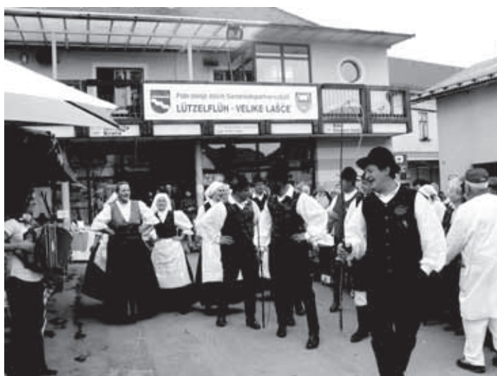
FOLKLORNA SKUPINA, KI JO SESTAVLJAJO ČLANICE DPŽ IN ČLANI KONJEREJSKEGA DRUŠTVA VELIKE LAŠČE, JE S SVOJIM PRVIM NASTOPOM NAVDUŠILA OBISKOVALCE TRŠKEGA DNE.