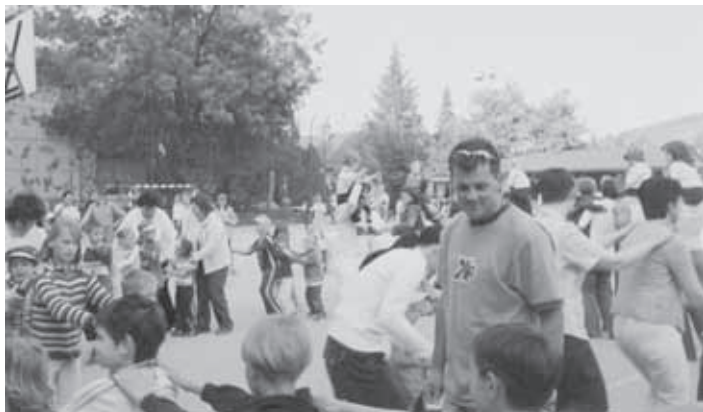
STARŠI SO Z NAMI ZAPLESALI "VLAKEC"