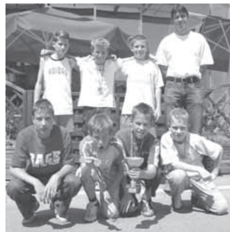
ODLIČNO DRUGO MESTO

Tekmovanje v malem nogometu za mlajše učence se je letos začelo 18. 4. 2005 na Igu, kjer je osem ekip sodelovalo na medobčinskem prvenstvu. Razporejeni smo bili v skupino s šolami Ig, Horjul in Log Dragomer. Osvojili smo prvo mesto (rezultati 3 : 0, 7 : 1, 6 : 0) in se v finalu dan kasneje pomerili z ekipo OŠ Dobrova. Z rezultatom 4 : 1 smo osvojili 1. mesto na medobčinskem prvenstvu in se uvrstili na področno tekmovanje. To je bilo v torek, 21. junija 2005, v Kočevju. Poleg domačinov (OŠ Ob Rinži) in naše ekipe, je sodelovala še ekipa OŠ Ferda Vesela, ki je zmagala na medobčinskem prvenstvu skupine Grosuplje.