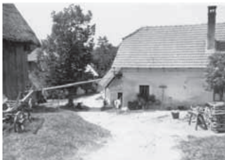
VAS LETA 1968

Nekaj ljudi je že reklo, da daje Rutarska planota - tako se imenuje celotno področje v hribih nad Robom, posebno energijo. Deležni jo boste že, ko se pričnete vzpenjati v hribe. Če se peljete po makadamski cesti kar naprej v notranjost, boste prispeli v vas Bane.