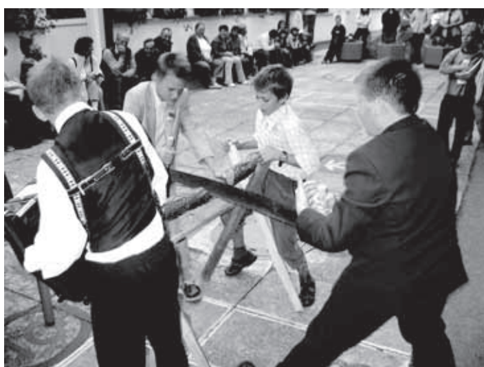
UČENCI OŠ PRIMOŹA TRUBARJA SO SE PREDSTAVILI S KMEĀKO OHCETJO.