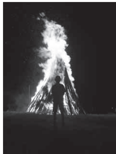
OB DNEVU DRŽAVNOSTI JE ZAGOREL KRES