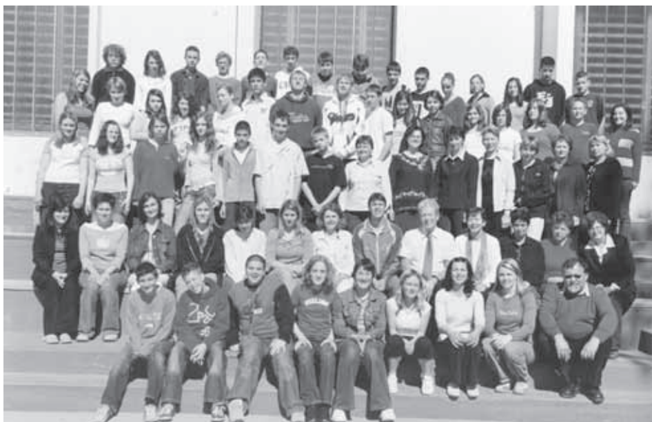
LETOŠNJA GENERACIJA 8. RAZREDA SKUPAJ Z UČITELJI