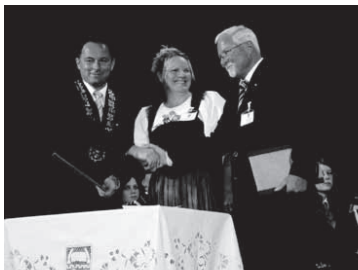
NA SLAVNOSTNI AKADEMII JE BILO SVEČANO POTRJEHO SODELOVANJE MED OBČINO LÜTZELFLÜH V ŠVICI TER OBČINO VELIKE LAŠČE.