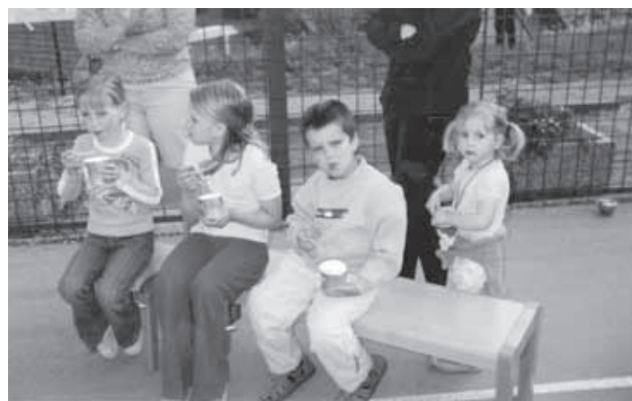
ZASLUŽILI SMO SI OSVEŽITEV S SLADOLEDOM

Potek srečanja je bil zasnovan z ustvarjalnimi delavnicami in rajanjem ob živi glasbi. Vsak otrok je imel možnost, da prehaja od ene delavnice k drugi ali pa vztraja pri delavnici svoje skupine. V skupini Muckov so izdelovali vetrnice, skupina Račke je pripravila material za izdelavo pokrivala iz papirja. V skupini Ježki so nastajale svojevrstne risbe. Otroci so risali z voščenimi barvami ter sodelovali v likovni razstavi. Mucki so svojo delavnico počitniško obarvali. Izdelovali so ladjice iz naravnega materiala. Plovnost le-teh pa preizkušali v vodnem igralu. V »medvedovi« skupini so nizali nakit, najmlajši pa so uživali v igralno-gibalnem poligonu. Spuščali so se po toboganu, se vozili z avtomobili, jih potiskali, se »lovili« s starši.