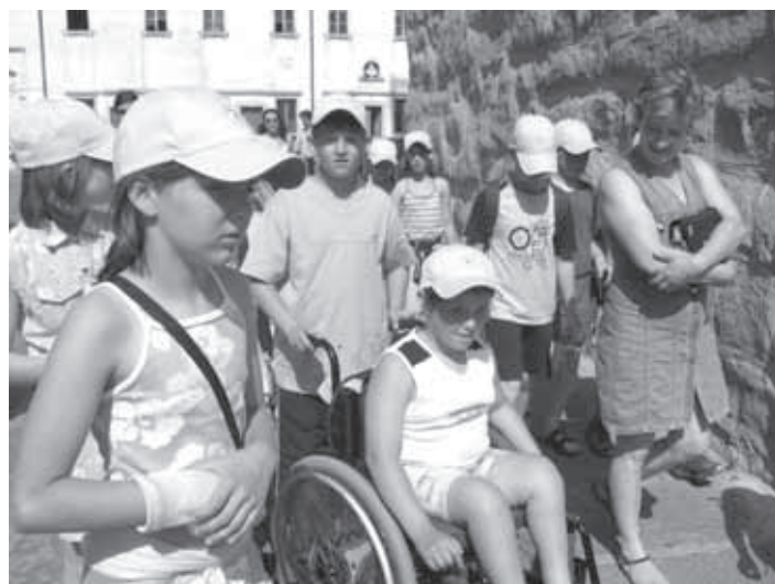
OGLEDALI SMO SI VELIKO ZANIMIVOSTI