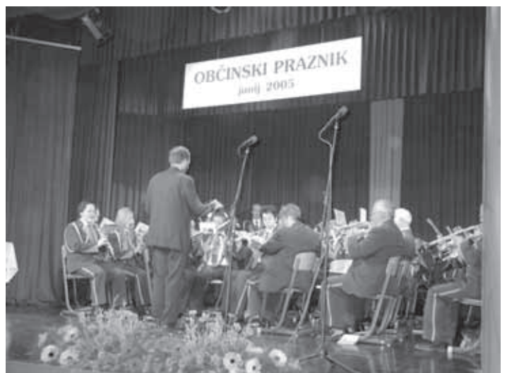
V KULTURNEM PROGRAMU SLAVNOSTNE AKADEMIJE JE SODELOVALA PIHALNA GODBA GRÜNENMATT-WALDHAUS