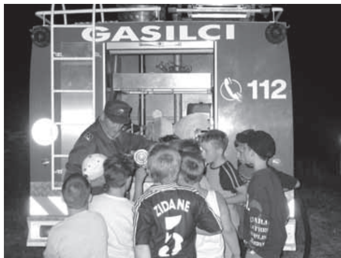
ZA POŽARNO VARNOST SO POSKRBELE TURJAŠKI GASILCI