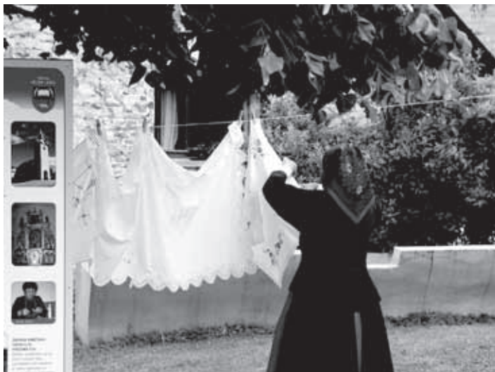
POHOD PO VELIKOLAŠKI KULTURNI POTI SE JE KLJUB DEŽJU LEPO ODVIJAL. ZANIMIVO PREDSTAVITEV SO PRIPRAVILI TUDI NA MALI SLEVICI.