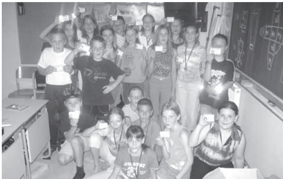
UČENCI 5.A RAZREDA S KOLESARSKIMI IZKAZNICAMI