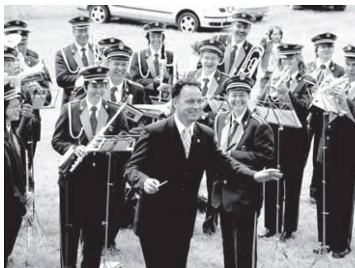
OB SLAVNOSTNEM KONCERTU PRI SV. PRIMOŽU JE TAKTIRSKO PALIČICO POPRIJEL KAR VELIKOLAŠKI ŽUPAN, A ZDELO SE JE, DA RAJE DIRIGIRA LJUDSTVU KOT GODBENIKOM.