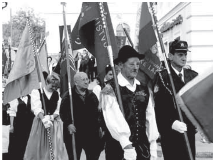
V SLAVNOSTNI POVORKI SO SE PREDSTAVILI TUDI PREDSTAVNIKI DRUŠTEV S SVOJIMI PRAPORI.