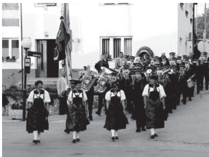
DEL POVORKE JE LETOS PREDSTAVLJALA TUDI ŠVICARSKA GODBA.