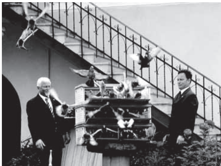
OPOLDNE STA ŽUPANA IZPUSTILA 100 GOLOBOV.