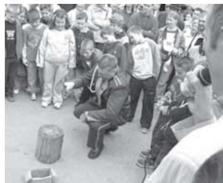
GOSTJE IZ ŠVICE SO SE VKLJUČILI V VSEBINE TRŠKEGA DNE