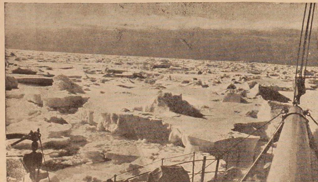
Ekspedijska ladja »Thero« v večnem ledu Antarktike

V geofizičnem letu 1957/58 pripravlja dvanajst držav ekspedicije na kopno Južnega tečaja, tako imenovano Antarktiko. Ena doslej največjih bo prav gotovo ekspedicija, ki jo pripravlja Britanska skupnost narodov, predvsem Anglija, Nova Zelandija, Avstralija in Južna Afrika. Antarktiko, ogromen kontinent s 14 milijoni kvadratnih kilometrov površine in do 5.000 m visokimi gorami, ni važna samo kot strateška, marveč tudi kot surovinska baza z bogatimi zakladi premoga in rude, zlasti urana. Ekspedicijo vodi 48-letni dr. Viv. E. Fuchs, profesor geologije na univerzi v Cambridgeu, najzanimivejša osebnost med udeleženci pa je prav gotovo Novozelandsčan Sir Edmund Hillary, zmagovalac nad najvišjo goro sveta — Mount Everestom.