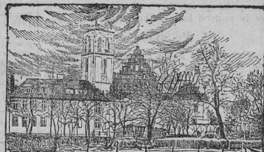
Der Brand der Martinikirche in Münster.

Zopet se je zgodila cela vrsta večjih požarov, od katerih prinaša naša slika dva. Zgoraj vidimo starodavno krasno cerkev sv. Martina v mestu Münster. Ljudje, ki so zvonili, so v svoji lahkomiselnosti kadili in na ta način ogenj v cerkev zanesli. Požar je bil naravnost velikanski in iskre so zanesle plamena tudi na sosedna poslopja, od katerih so trije pogoreli. — Druga slika (spodaj) nam predočuje pogorelo fabriko malca v mesta Sangerhausen. Pri tem velikanskem požaru so tudi tri osebe svojo smrt našle. Skoraj vsi gasilci so bili težko ranjeni. Gasilna dela so trajala več dni, predno se je tleči ogenj popolnoma zadržilo.