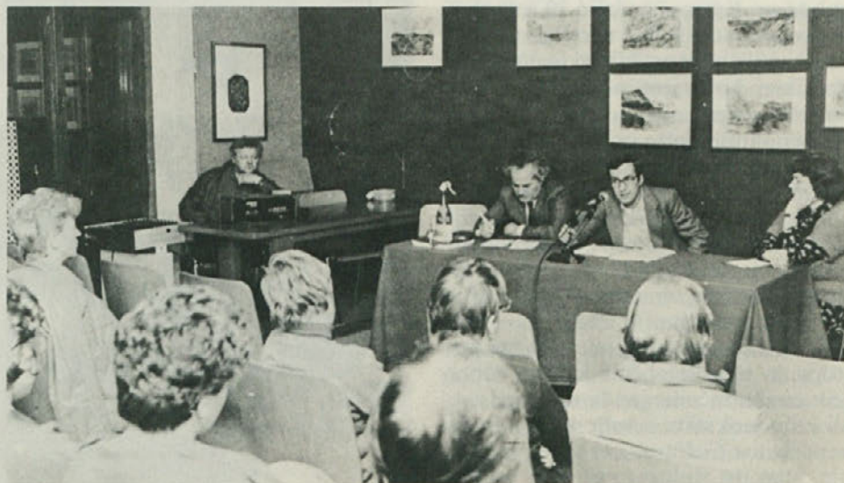
Prejšnji teden je knjižnica «P. Tomažič» na Opčinah organizirala srečanje s predstavniki Skupine 85, ki so prikazali svoje delo v prid medsebojnemu spoznavanju in sožitju obeh tu živčih narodnosti.