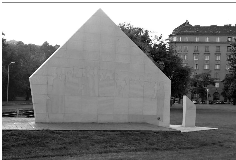
Spomenik deportirancem v Budimpešti iz let 1950–1953.

Pomemben korak pri obravnavi deportirancev je bilo odkritje spomenika leta 2010 (ob 60. obletnici deportacij) v spomin deportirancem med letoma 1950 in