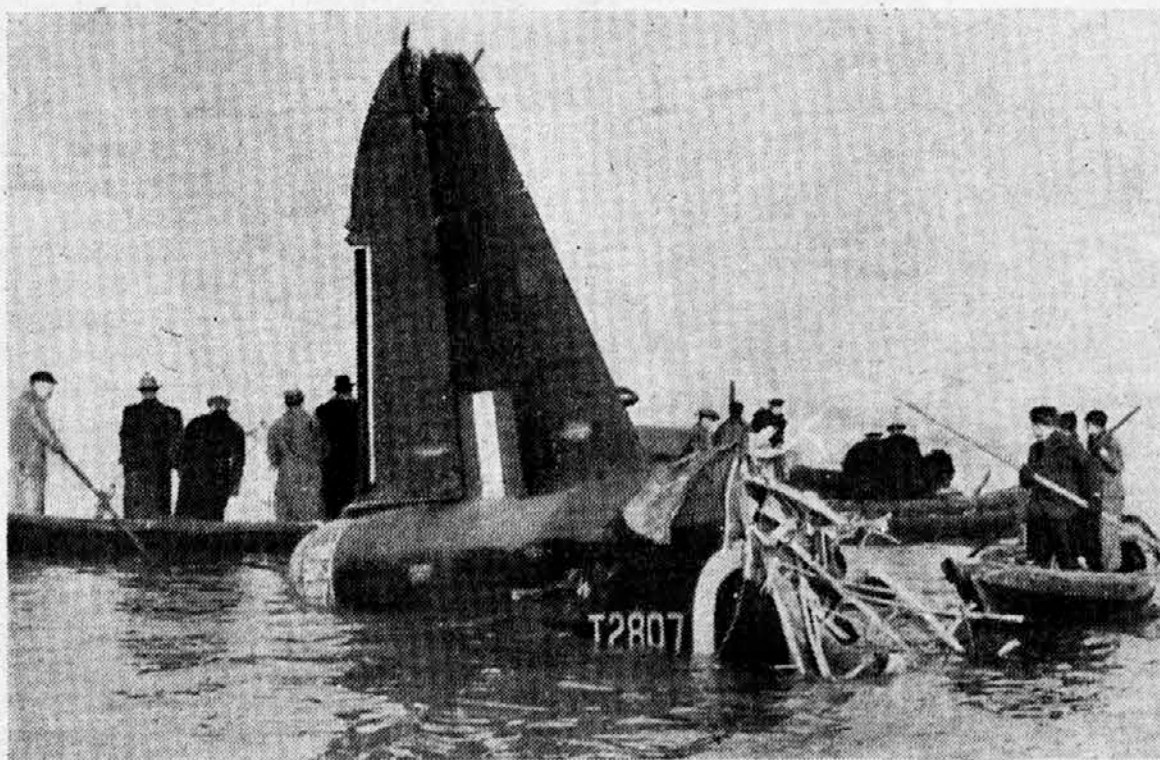
Angleški zrakoplov uničen od italijanske lovske eskadrilje.

Južnovzhodno od Ilmenskega jezera je sovražnik nadaljeval svoje brezuspešne napade.