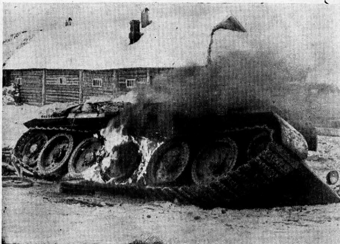
Sovjetski tank uničen od nemških lovcev v bližini Moskve.

S takimi kulturnimi stiki se narodi spoznavajo in zblizujejo. Na tak način delajo za skupnost in mir.