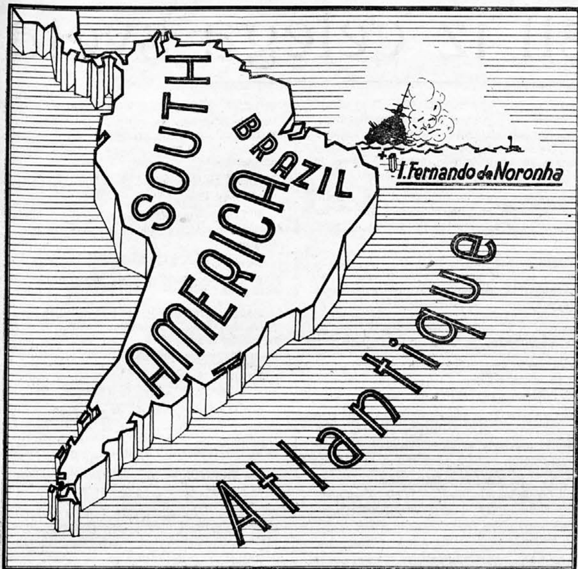
Povratak iz Sv. Fernanda v Nohorni.

Na Laponskem so nemške čete prihorile v napadu nadaljnje ozemlje. V teku bojev obkoljena skupina sovražnikovih sil je bila uničena. V neki luci polotoka Kola so poškodovala letala tri večje tovorne ladje in sicer eno tako hudo, da se mora računati z njeno izgubo.