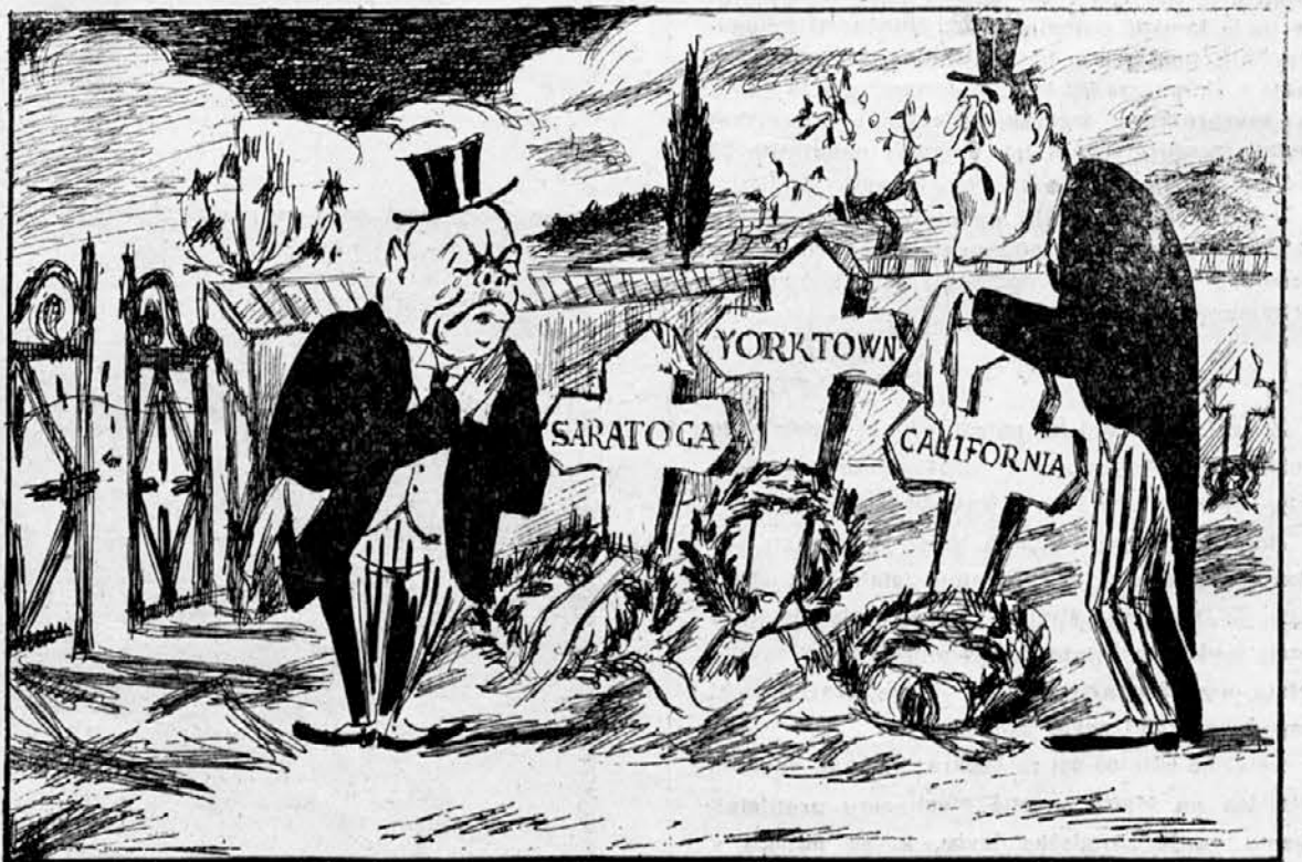
Edini mrtveci, ki jih prisilijo k joku.

LIZBONA — Prispeli so v Lizbono osovinski poslaniki, ki se vračajo iz Amerike.