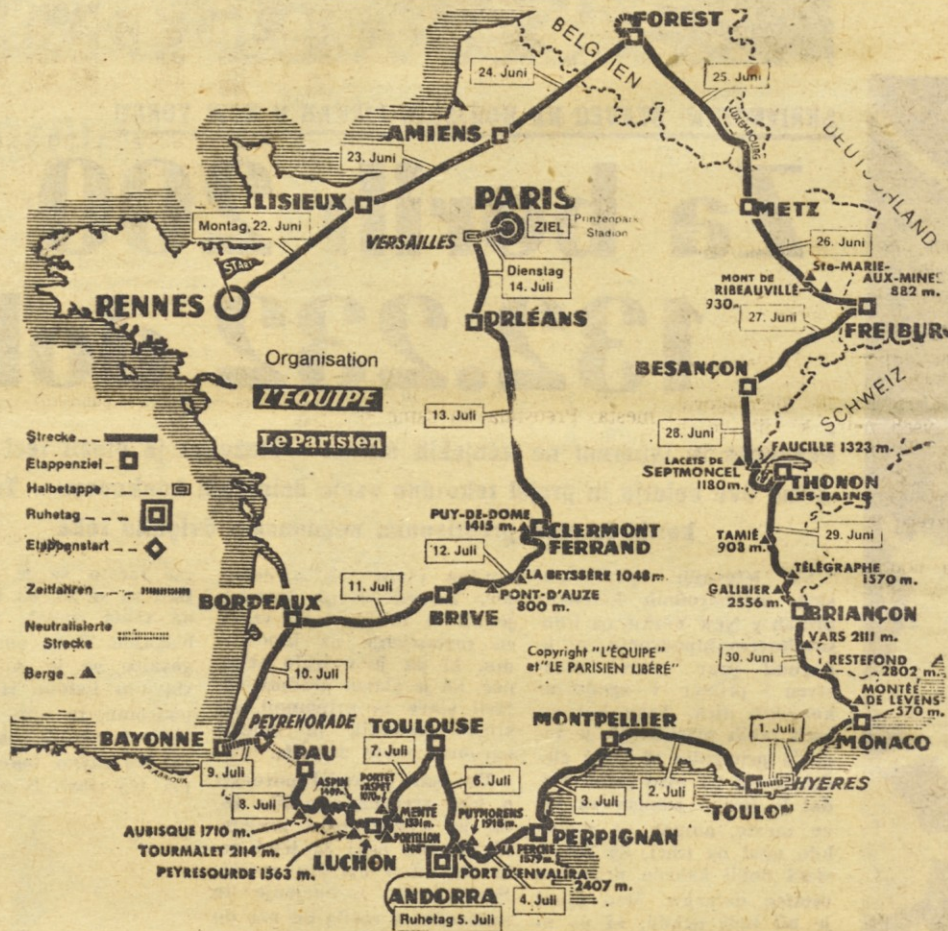
Načrt proge za letošnje kolesarsko dirko po Franciji, ki se bo pričela jutri v Rennesu

Sovjetska zveza - Danska 3:0 (2:0). Barcelona, 60.000 gledalcev, sodnik Lo Bello (Italija), strelci Voronin v 18., Ponedelnik v 40. in Ivanov v 87. minuti. Sovjetska zveza: Jašin, Kornejev, Mudrik, Goltov, Sesternov, Voronin, Malafejev, Cislenko, Ivanov, Ponedelnik, Kopajev, Danska: J. Nielsen, J. Hansen, K. Hansen, B. Hansen, Larsen, E. Nielsen, Berthelsen, Thorston, Madsen, Sörensen, Danielsen.