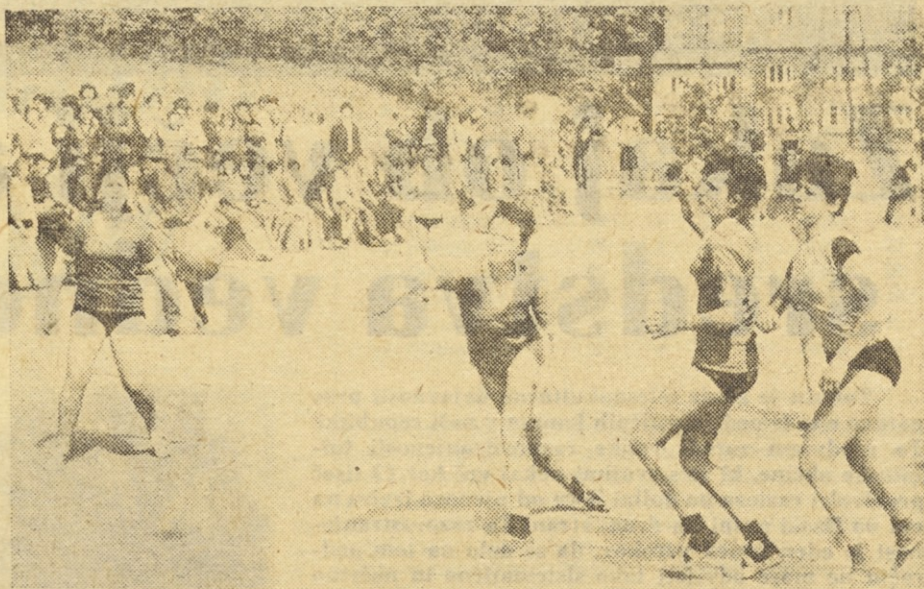
Igralci rokometna so zaključili svoja ligaška tekmovanja in na vrsti je še nekaj kvalifikacij za vstop v višje tekmovanje