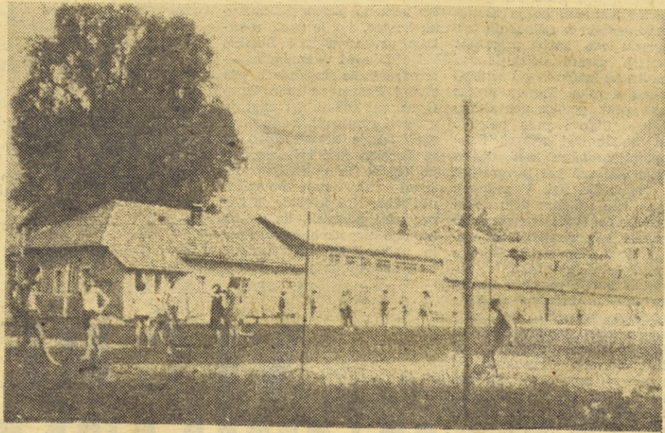
Skromne športne naprave in igrišča v nedograjenem športnem parku v Tolminu so vedno polna športnega izživljanja žele mladin.

Zaradi vse večje aktivnosti, bi bilo razumljivo, da bi se sredstva za telesno kulturo vsako leto povečala. V Tolminu pa je ravno obratno. Leta 1962 je bilo za osnovno dejavnost telesnokulturnih organizacij in za objekte iz občinskega proračuna dodeljenih 3,5 milijona dinarjev. V preteklem letu se je ta vsota znižala za 700 tisoč din. V letošnjem letu pa je za telesno-kulturno dejavnost namenjeno le dva milijona dinarjev. S tem bodo lahko krili le stroške občinskih tekmovanj, del sredstev pa bodo razdelili med društva za njihovo osnovno dejavnost. Torej, o nujno potrebni zaposlitvi profesionalnega kadra ne morejo misliti. Zaradi pomanjkanja finančnih sredstev tudi delo ObZTK Tolmin ni zažvelo v takšni širini, kot bi želeli in kot kažejo zahteve teh krajev. Dobra volja in prizadevnost je v današnjih pogojih vse premalo in čudno se nam zdi, da ta problem kljub gospodarski rasti tolminske občine še vedno ostaja nerešljiv?!