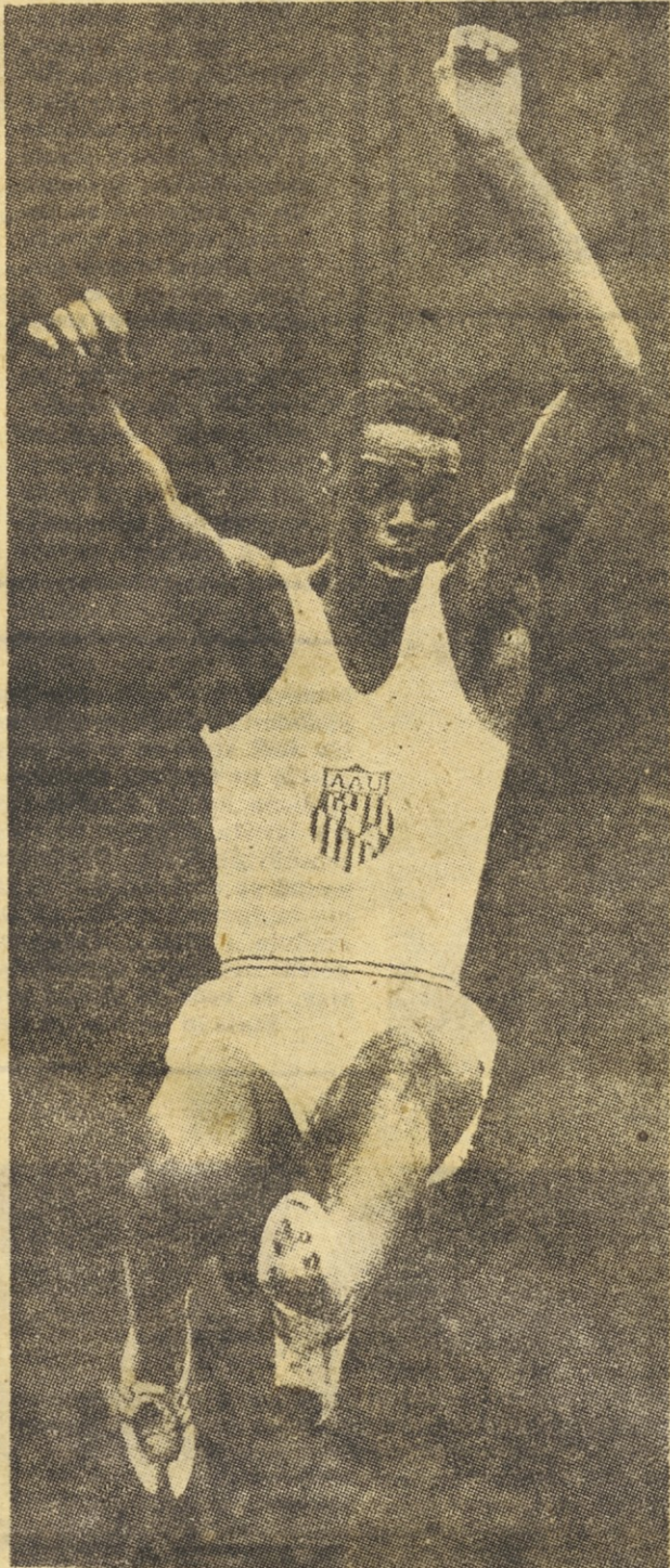
Ralph Boston (ZDA) je skakalec, ki je doslej največkrat preskočil 8 m – skupno več kot 40-krat. Bo on je kljub temu, da je Ter-Ovanesjan (SZ) svetovni rekorder, glavni favorit v Tokiu