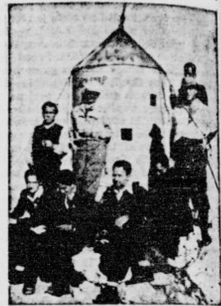
Kralj Peter II. prvič na Triglavu. Pri Aljševev stolpu. Kralj sedi drugi od leve.