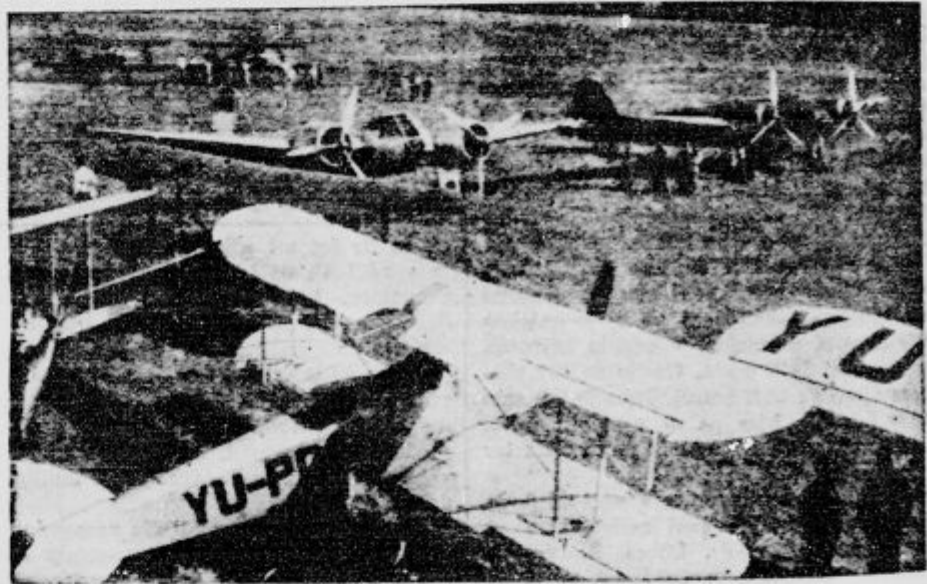
Pogled na ljubljansko letališče. Dva lahka bombnika, ki zmoreta 400 kilometrov na uro.