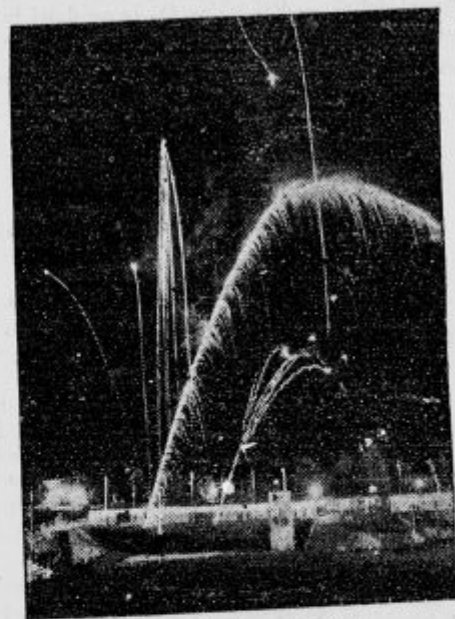
Slika z ognjemeta na Stadionu.