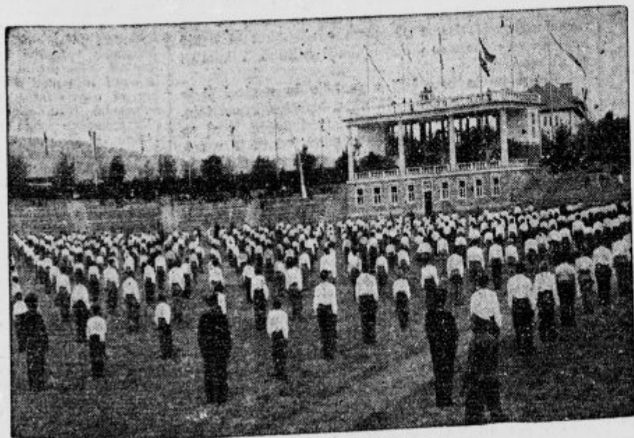
Vaja naračevalnikov na Stadionu