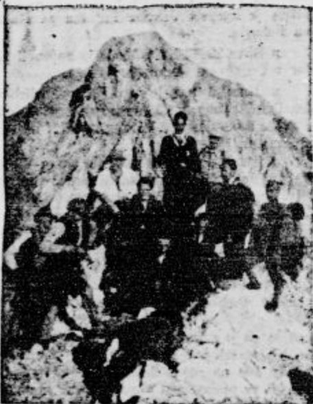
Pogled z vrha Triglava na Mali Triglav. Kralj sedi v sredi.