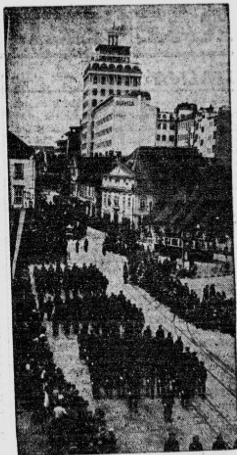
Gasilske čete korakajo po Dunajski cesti.