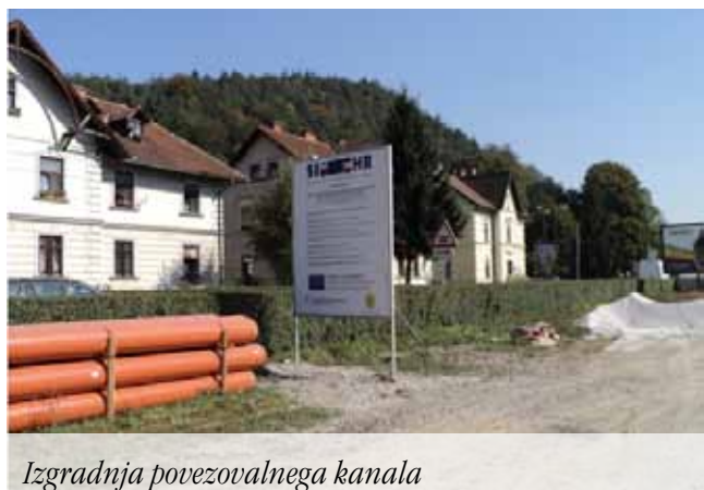
Izgradnja povezovalnega kanala

Olimia v Podčetrtku udeležila, je bila navdušena nad projektnimi rezultati.