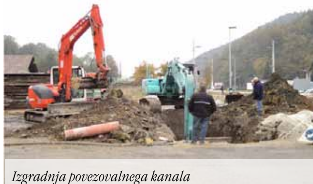
Izgradnja povezovalnega kanala

Projekt, katerega začetki segajo v september 2009, se zaključuje v prihodnjem letu. To obdobje je bilo uspešno za vse projektne partnerje, saj smo oz. še dosegamo bogate rezultate. Omogočili smo vzpostavitev okoljskih pisarn in info točk in s tem pripomogli k večji ozaveščenosti o inovativnih varstvenih ukrepih med prebivalci in obiskovalci projektne območja. Zaključili smo investicijska