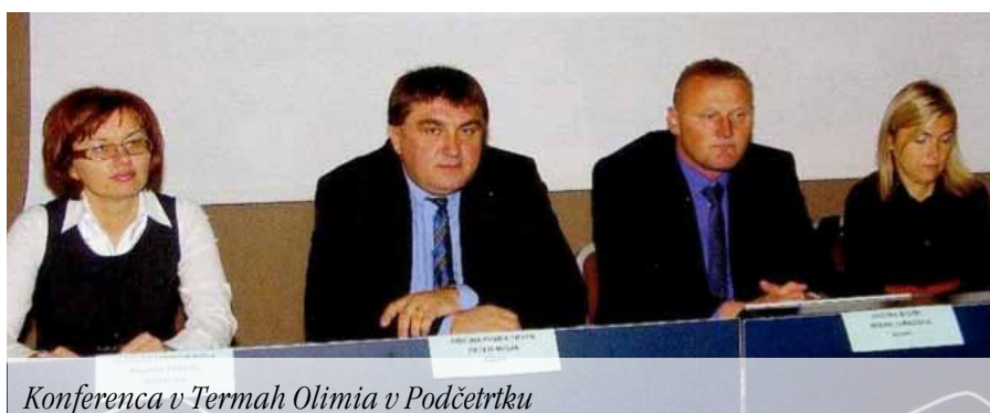
Konferenca v Termah Olimia v Podčetrtku

V sklopu projekta »Oblikovanje skupnih čezmejnih okoljskih standardov« z akronimom »48 UR«, ki vključuje oblikovanje okoljskih standardov na projektnem območju ob slovensko-hrvaški meji, je bila 18. novembra 2011 organizirana konferenca, na kateri so predstavniki projektnih partnerjev predstavili izvedene projektne aktivnosti. Znanje in delovne načrte so v projektu združili občine Štore, Podčetrtek, Zagorska Sela, Razvojna agencija Sotla in okoljsko-raziskovalni zavod iz Slovenskih Konjic, rezultate pa