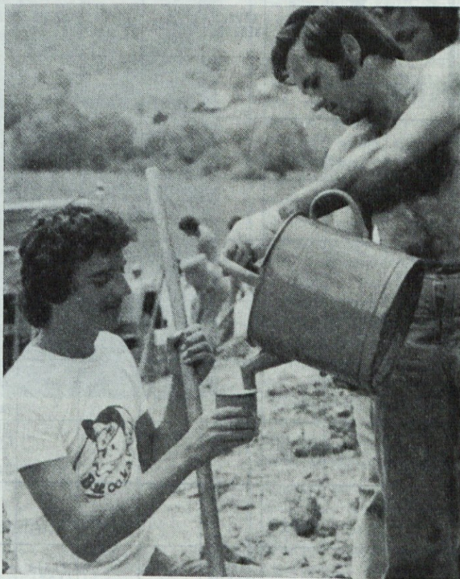
Požirek vode za brigadirja

Odgovorov po tej točki do zaključka redakcije še nismo prejeli.