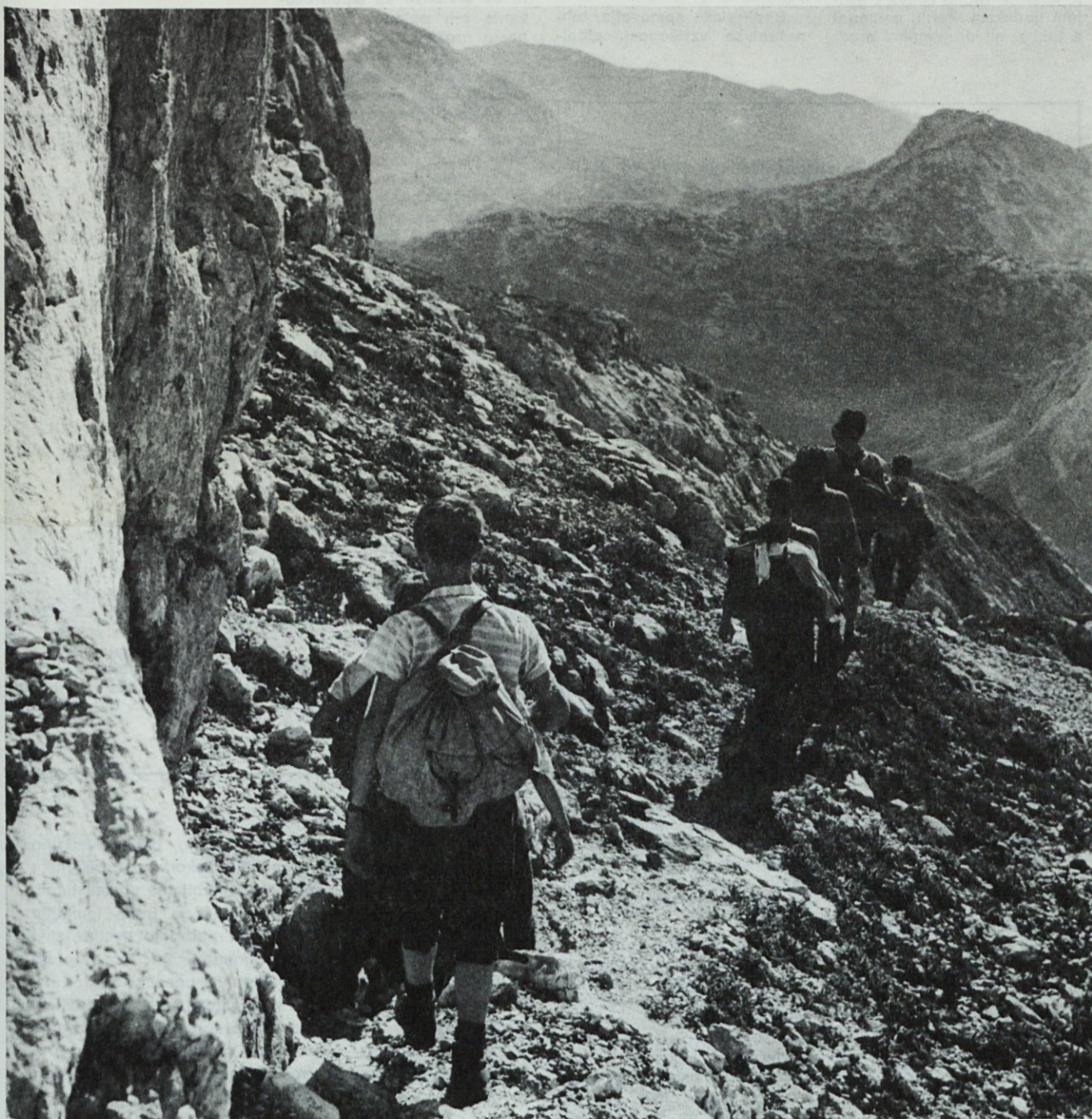
Prelepe naše planine — cilj naših planincev

Takšne zgodovine nismo preživeli, da bi jo pozabili; nauki so preveč dragoceni. Ravno zaradi tega toliko bolj bode v oči dejstvo, da tako napreden in demokratičen državnik (kancler Kreisky) pristaja na tako nazadnjaške in nedemokratske teze kot je »Urangst«. Namen teh besed ni želja žaliti Avstrijca, ki misli drugače, zlasti ne novih generacij, ki niso krive za preteklost, ampak opomniti na »vprašanje, ali ne bi bil južno od Karavank upravičen neki prastrah (Urangst), nasproten tistemu, ki ga nemški šovinisti razglašajo na Koroškem«.