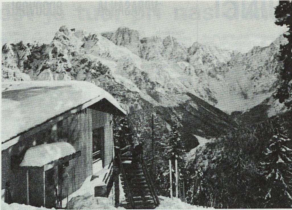
Dom na Vitrancu