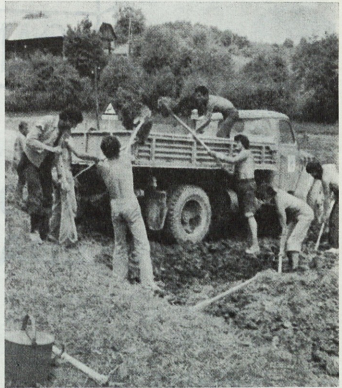
Akcij mladinskih delovnih brigad je konec! Ali so na tej sliki mladinci iz Avtotehne? Mogoče jih ni — mogoče so bili drugje — ali kdo to ve?