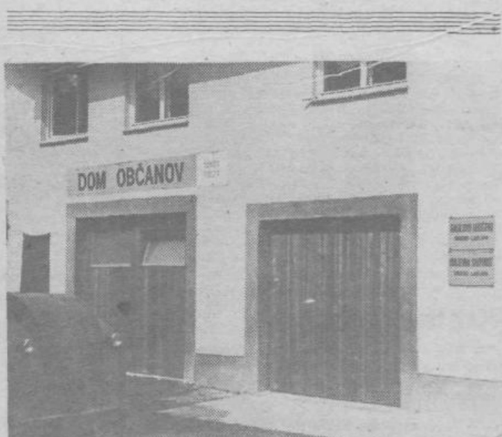
Smarčani so se končno le dokopali do novega doma občanov.

– Vsi pristojni dejavniki naj si prizadevajo za enakomerno obremenitev šolskih okolišev v Ljubljani ter za smotno koriščenje šolskih in vzgojno-varstvenih prostorov.