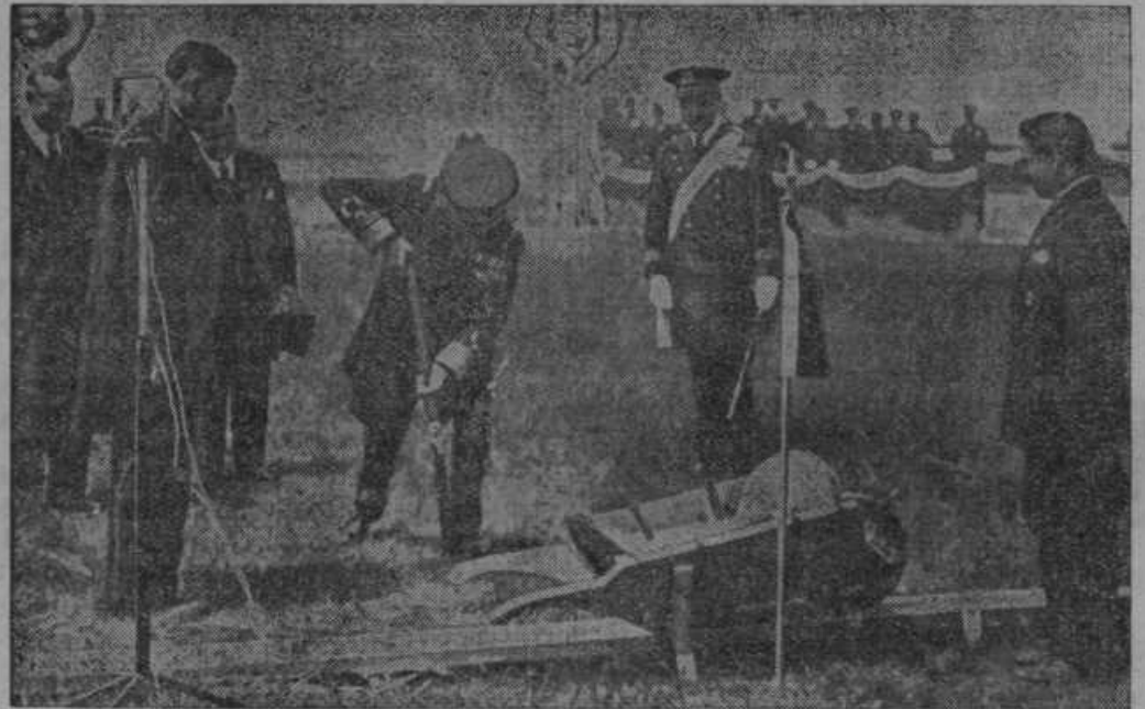
Madjarski regent Horthy zasađa lopato v zemljo in s tem slovesno otvarja zemeljska dela za zgradbo proste luke v Budimpešti.

Opozorilo kmetom-dolžnikom. Tisti kme-tje-dolžniki, ki dolgujejo denarnim zavo-