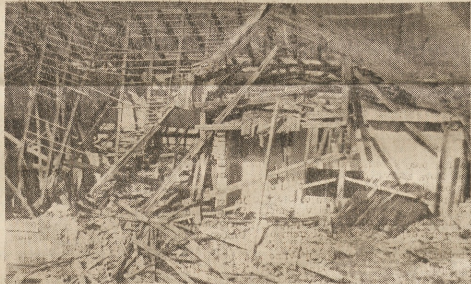
Tako je bilo ob osvoboditvi...