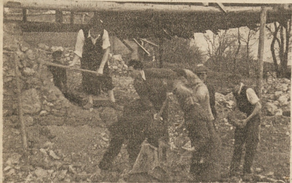
Delavci pospravljajo ruševine v vasi Vrh

Marsikateri Zagorjan je še sladko spal, ko smo zapeli uslužbenci strojnega in elektrobrata v mlado jutro. Dva avtomobila sta nas že čakala na zbirališču, od koder smo se v veselem razpoloženju odpeljali na delo v vasi Dolgo brdo in Vrh, kamor smo šli obnavljat požgane in porušene domove tamkajšnjih kmetov.