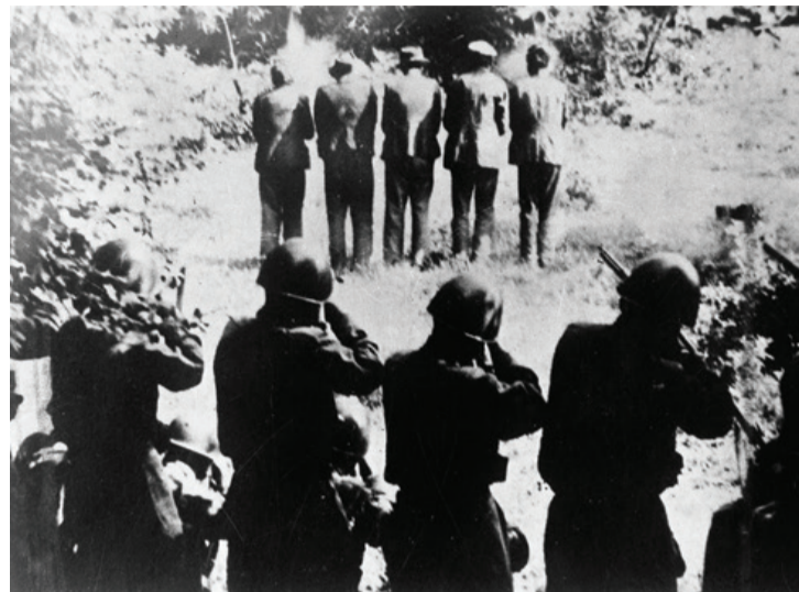
Italijanski vojaki so na Križni gori pobili pet talcev iz Dan v Loški dolini.