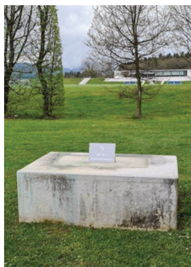
Prazen podstavek na Brdu, kjer je nekdanji stal spomenik Josipu Brozu Titu.