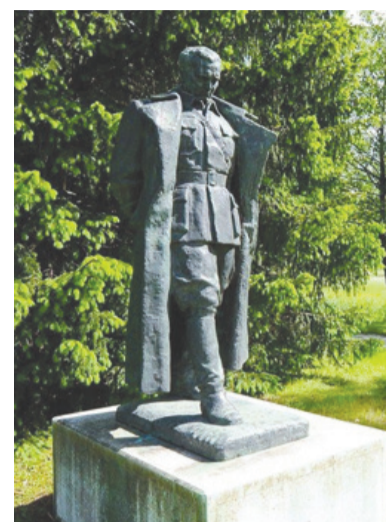
Takšen je bil spomenik pred odstranitvijo.