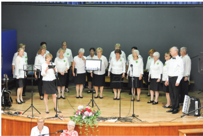
Ženska vokalna skupina Zimzelen Nova Gorica