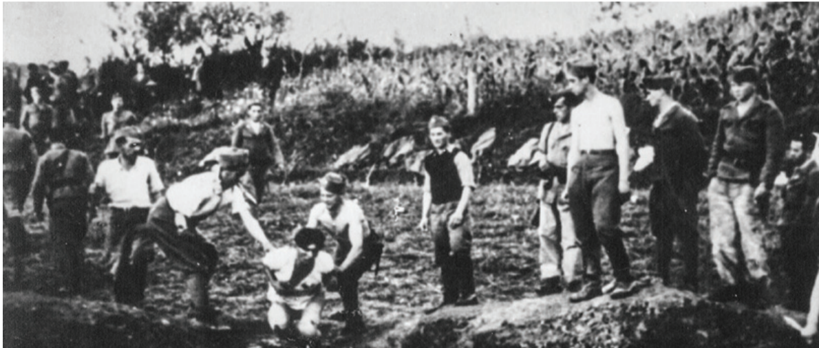
Ustaši pri pobijanju internirancev, tudi Romov, v Jasenovcu

Treba je opozoriti, da so bili Romi v taboriščih med najbolj pogostimi žrtvami medicinskih poskusov: številnim so vbrižgavali strupe, jih sterilizirali, izpostavljali so jih strupenim plinom, ekstremno visokim ali nizkim temperaturam, lakoti, številnim boleznim in brutalnemu