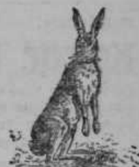
Zajec: 6—10 let