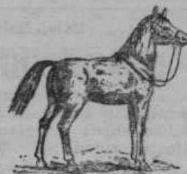
Konj: 25—30 let