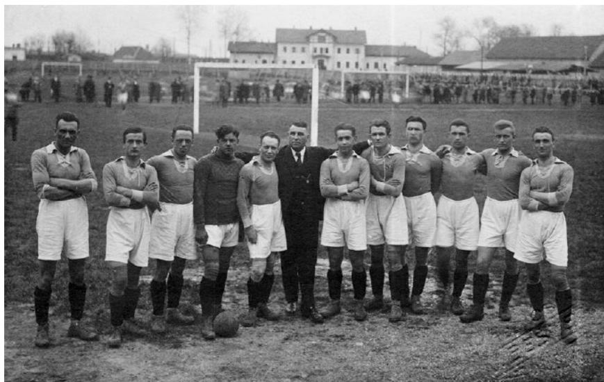
Slika 5: Moštvo SK Ilirije iz leta 1924.