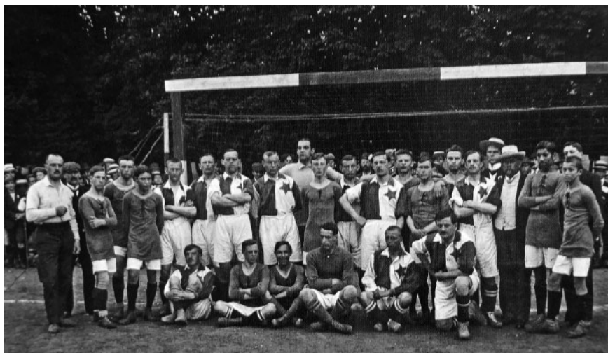
Slika 2: Moštvi SFK Ilirije in SK Slavije iz Prage pred tekmo v Ljubljani 2. julija 1913.

Med letoma 1911–1914 so ilirijani odigrali 47 tekem, večino v Ljubljani, in sicer 39. Osemkrat so gostovali, in to leta 1911 v Kranju, leta 1912 na Sušaku, v letih 1912, 1913 in 1914 v Zagrebu in leta 1914 v Opatiji. 15 Svojo zadnjo tekmo je Ilirija odigrala 25. oktobra 1914, ko so se zeleno-beli pomerili s kombiniranim moštvom Olimpije in Slovana, okrepljenim z nekaterimi tujimi nogometaši, ki so bili v tistem trenutku v Ljubljani. To je bila tekma, na kateri so zbirali sredstva za Rdeči križ, bila obenem tudi zadnja tekma Ilirije pred krvavim začetkom prve svetovne vojne. 16