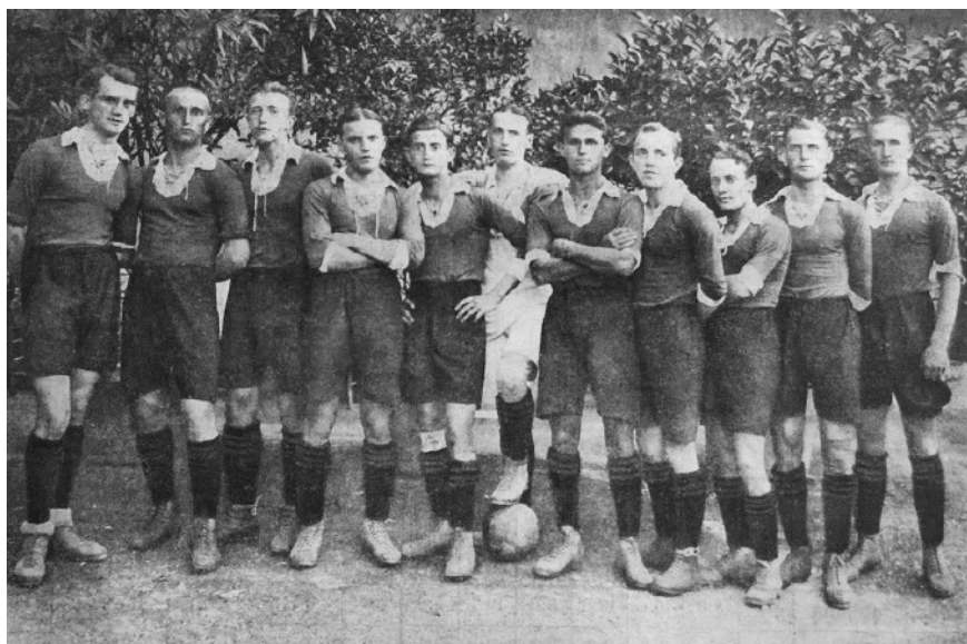
Slika 3: Moštvo SK Ilirije, ki je osvojilo premierno prvenstvo Ljubljanske nogometne podzveze leta 1920. Vir: Sport , št. 8, 14. 8. 1920, str. 1.

S koncem prve svetovne vojne in po nastanku jugoslovanske države 17 so se spomladi 1919 zbrali preživeli ilirijani na občnem zboru. Potrdili so predvojno usmeritev v širjenje športnega programa ter sklenili preurediti Ilirijo iz nogometnega v športni klub, iz enovitega ali homogenega v raznovrstni ali heterogeni športni klub.