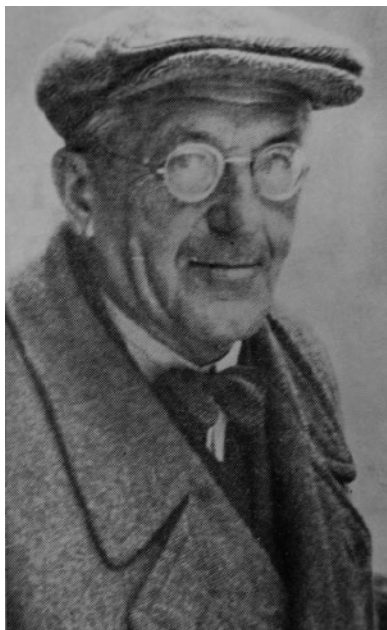
Slika 7: Inženir Stanko Bloudek (1890–1959), pogosto imenovan tudi »oče slovenskega športa«. Vir: Stepišnik, Stanko Bloudek , str. 6.

1936 odklonili uvedbo profesionalizma v Ilirijino nogometno sekcijo. 58 Bloudek pri tem navaja, da so se dogodki po omenjeni seji začeli naglo odvijati: »Z okrnjenim moštvom smo po vrsti izgubili podsavezne prvenstvene tekme, prepustili nekatere brez igre nasprotnikom in se našli na zadnjem mestu tabele«, ter nadaljuje, »sporedno so dozorela tudi pogajanja za združitev naše sekcije z nogometno sekcijo SK Primorja v nov nogometni klub »Ljubljana«, za katero se je zavzemala tudi večina našega starešinstva.« 59