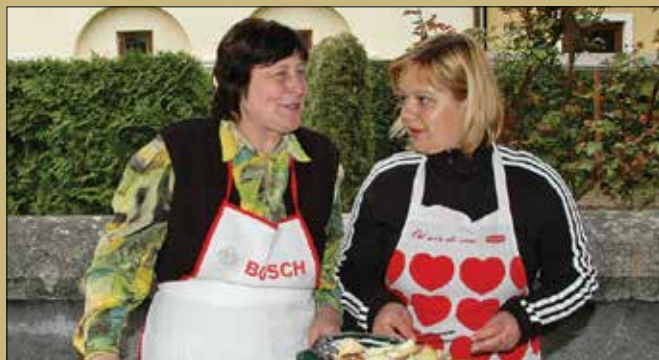
Najboljše salame po okusu obiskovalcev je nudila stojnica Mikekovi.