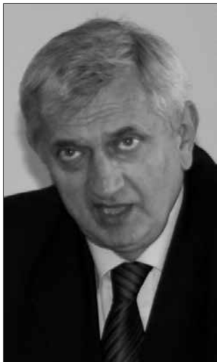
Veleposlanik Zdravko Begović

Tu gre najprej za naložbe na energetske področje, kjer bodo gradili tako termo kot hidroelektrarne, saj imajo dovolj surovinskih virov. Poleg tega je nujna izgradnja komunikacijskih poti in cestne infrastrukture. Na obeh področjih je Begović naštel konkretne projekte, kjer je možnost, da slovenska pod-