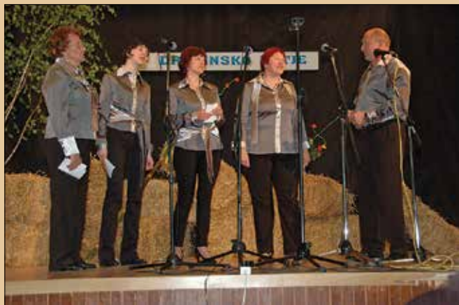
Družina Bele iz Zibike na Kozjanskem je redna gostja vseh srečanjskih ljudskih pevcev po Sloveniji.