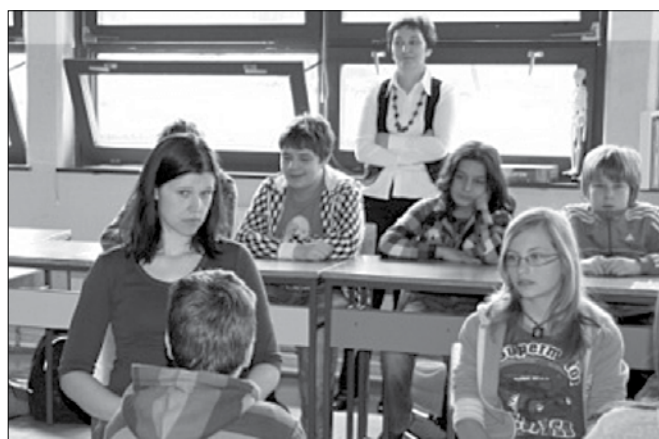
Rečiški učenci so izvedli štiri delavnice in z njimi navdušili učence in učitelje na Osnovni šoli Kuzma.

Učenci so se predstavili tudi zunaj naše šole, in sicer so podob-