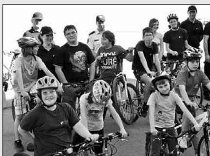
Mladi gasilci so se udeležili preventivne kolesarske akcije.

Mladi gasilci so se pomerili v spretnostni vožnji med postavljenimi ovirami. Slednjih je na poti od njihovih do gasilskega doma veliko, zato se jih morajo naučiti čim bolj spretno izogibati in premagovati. Mentorji so z nasveti in vzpodbujanjem vsem udeležencem akcije omogočili prijetno pridobivanje izkušenj, nabiranje znanj, ki jih bodo potrebovali tako v pro-