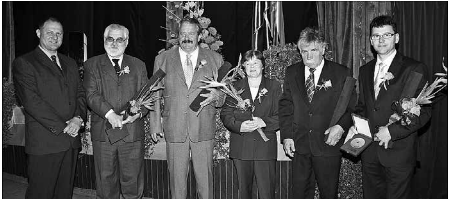
Prejemniki priznanj občine Mozirje za leto 2011 z županom Ivanom Suhoveršnikom

Slavnostni govornik, župan Ivan Suhoveršnik se je ozrl na preteklo leto skozi investicije, izvedene programe in želje, ki še čakajo na izpolnitev. Zavedajoč se dejstva, da kljub delovni vne- mi in stalni pripravljenosti delati dobro in v korist