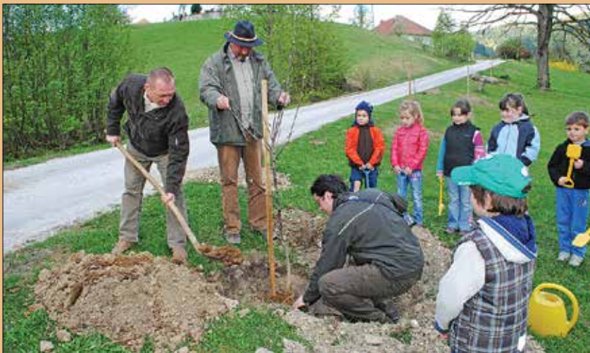
Sajenje ene izmed mnogih jablan