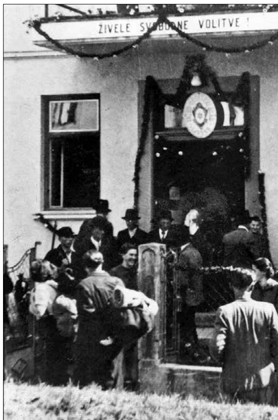
Volitve na osvobojenem ozemlju jeseni leta 1944. Prizor je z Ljubnega ob Savinji, fotografijo hrani Muzejska zbirka v Gornjem Gradu.

Legenda pravi, da je to skalo nekoč prinesel sam hudič. Takole pripoveduje zgodba: Blizu Savinje je nekoč v davnih časih živel zelo reven mali kmet. Kočar je imel le kravico. Da bi lažje preživel, si je pomagal z ribolovom v Dreti in Savinji. Toda klošterski niti graščinski ribolova niso dovolili. Nekoč je opazoval, kdaj gredo hlapci nazaj v grad. Tedaj je skočil v vodo in pod grmovjem nalovil nekaj rib. Že jih je videl v ponvi in ves vesel zavil plen v krpo platna. Tedaj zasliši lovski rog in zagleda gručo lovcev in hlapcev, ki so ga seveda hitro opazili. V stiski je zaklel, da mu zdaj naj pomaga sam vrag. In ta se je takoj pojavil. Spretno je skrnil kmetiča pred zasledovalci. Potem sta se dogovorila, da ga bo vrag še tri leta varoval pred kaznijo za ribolov. Kot plačilo si je vrag izgovoril njegovo dušo.