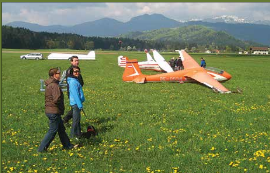
Na Zgornjem Pobrežju so se zbrali jadralni letalci iz Kočevja, Maribora, Celja, Slovenj Gradca, Lesc in Ljubljane.