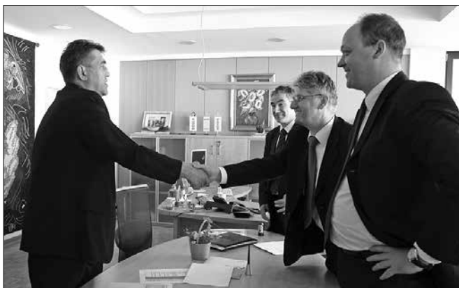
Slovesen podpis pogodbe med predstavniki BSH Hišni aparati Nazarje in HTZ Velenje