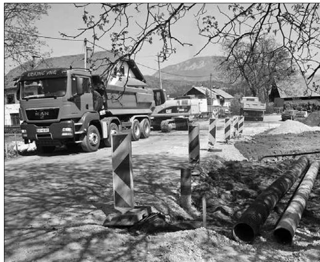
Dela na cesti skozi Bočno so v polnem zamahu.

Na regionalni cesti Nazarje-Gornji Grad so nedavno pričeli z rekonstrukcijo odseka skozi Bočno. Zaradi tega je tam promet delno oviran. Hkrati bodo napeljali tudi kanalizacijo, v Bočni pa prenavljajo tudi cesto Kropa-Otok.