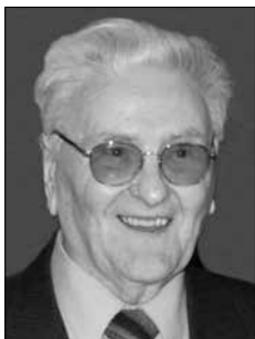
Piše: Aleksander Videčnik

Ves Matkov kot je bil nekoč pod vodo, tako govori ljudsko izročilo. Veliko jezero je dajalo dom hudemu lintverju, zato se ta kraj še danes imenuje Jezera. Tam okoli so se pasle krave kmeta Žibovta. Če je katera prišla preblizu jezera, jo je zmaj ujel in pod vodo požrl. V jezeru je bilo dosti rib, ki so jih domačini lovili z mrežami. Sušili so jih na veliki skali, ki ji še danes rečejo Ribja peč.