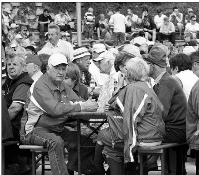
Utrinek iz lanskega praznovanja 1. maja na Graški Gori

Če smo v preteklem letu v tem času v Savinjskih novicah zapisali, da se gospodarska kriza umika, letos temu ne moremo dati kakšnih spodbudnih besed. Kriza se mogoče res umika na papirju, državljani pa kljub temu ne čutimo kakšne vznesenosti. Mogoče je temu razlog tudi v številnih zakonodajnih spremembah, ki jih pripravlja naša vlada, in katere bodo brez dvoma vplivale tako na mlade kot delavce in upokojeince.