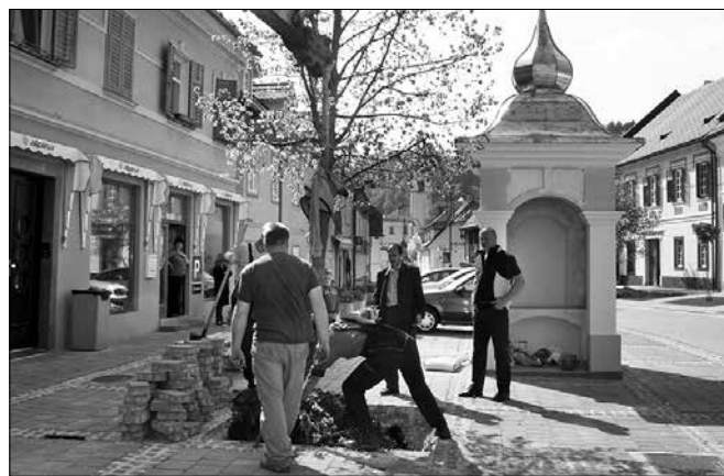
Trška lipa je bila iz prejšnjega mesta ob starem in sedaj odstranjenem znamenju prestavljena ob novo kapelo.

Iz starih razglednic in fotografij Mozirja je razvidno, da je sredi trga včasih stala kapela, ki je kazala pot proti župnijski cerkvi sv. Jurija. Kapela je bila zaradi širjenja ceste leta 1931 podrta, Marijin kip, ki je bil v njej, pa je dobil zatočišče v župnišču.