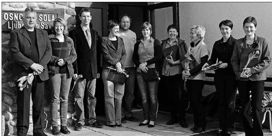
Svoje znanje italijanščine bodo udeleženci uporabili pri komunikaciji s turisti ali na potovanjih v Italijo.