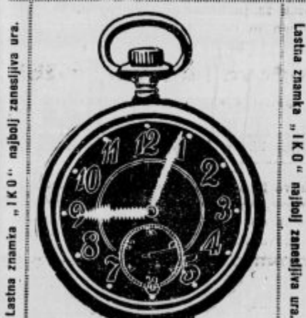
Lastna znamka „IKO“ najboljši zanesljiva ura.

tako se stiši mnogokrat popraševati ljudi, kateri pač imajo uro v žepu ali na steni, ampak svoji lastni uri ne verjamejo, ker je le slaba, netočna, vedno stoječa bazar ura. Kdor nasprotno ima Suttnerjevo uro, ve vedno natanko, kako pozno je.