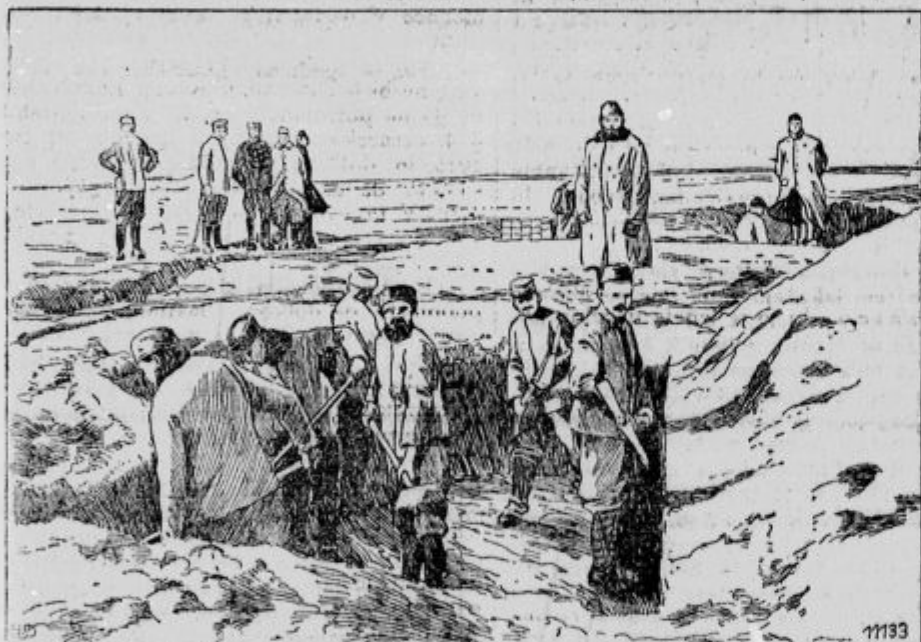
Postojanke zaveznikov v Solunu.

Strašno delovanje avstrijskih topov. Laški listi opisujejo zlasti strašne topovske boje v južnih Tirolah ter trde, da deluje na 40 km dolgi črti dva tisoč topov in da so padale krogle kakor toča na laške postojanke, kajti o strelskih jarkih ni mogoče govoriti, ker je bilo vse razbito. Italijanom ni preostalo drugega, kakor da so se morali umakniti. Vse gore so pa polne Avstrijcev, ki napadajo povsod z nenavadno silo. Ko se je laška armada jela umikati, so nastale zmede v zgornji Italiji. Povelje, da se morajo kraji izprazniti, je došlo nepričakovano zlasti, ker se je prej zagotavljalo, da se ni bati hudega. Mesto Vicenzo