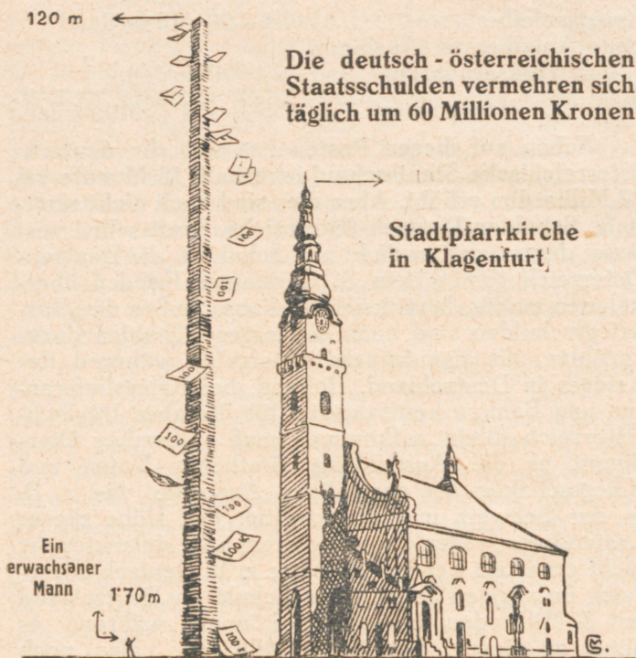
Bild 3. — Deutsch-Österreich leistet sich täglich 60 Millionen neuer Staatsschulden. Diese tägliche Staatsschuld ergibt in Hundertkronennoten berechnet einen 120 m hohen Stoß, also eine Höhe, bei deren Vergleich ein erwachsener Mann schon beinahe verschwindet. Und um einen solchen Hunderterhaufen vermehrt sich täglich die deutsch-österreichische Staatsschuld. Schauer erfaßt einen, wenn man nachdenkt, wo Deutsch-Österreich mit dieser Wirtschaft hinsteuert.

Jeder Tag verschlingt also in Deutsch-Österreich neue 60 Millionen. Jeden Tag erhöht sich nach den Angaben des H. Kraft die österr. Staatsschuld um neue 60 Millionen. Das ergibt eine ungeheuerer, Tag um Tag wachsende Summe, die jedoch wahrschein-