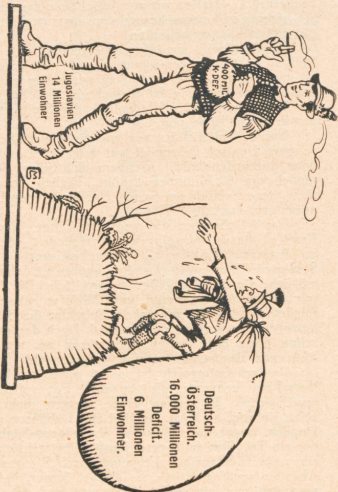
Bild 4. — Jugoslawien, welches doppelt soviel Einwohner zählt als Deutsch-Österreich, weist in seinem Staatsvoranschläge für das kommende Jahr nur einen Fehlbetrag von 400 Millionen Kronen auf. Deutsch-Österreich wird dagegen nach Angaben des H. Kraft einen Fehlbetrag von mindestens 16.000 Millionen Kronen aufweisen. Ist das nicht schrecklich?