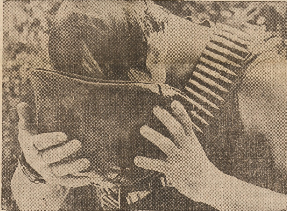
OSVEZITEV — Voda osvežuje, kjerkoli jo dobimo, ko nas trud in pot zdelujeta. Vojak v Južnem Vietnamu jo je zajel iz potoka, še st milj zahodno od Phu Bai in si hladi v njej glavo.