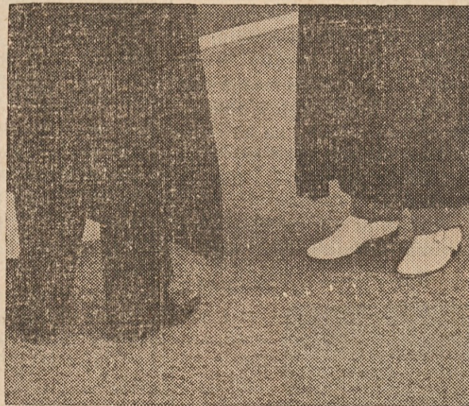
NOVI ČASI NOVE NAVADE! — Ob podelitvi diplom na univerzah je bilo nekaj vse silno slovesno. Zdaj je marsikaj drugače, kot kažejo te-le slike nog in obutve na dan graduacije na Ohio State University. Zgornja dva in levi spodnji prejemniki diplome so doktorji filozofije, spodnji pa doktor medicine.

Zalujoči: SOPROG in OTROCI ter OSTALO SORODSTVO Cleveland, O., 18. julija 1972.