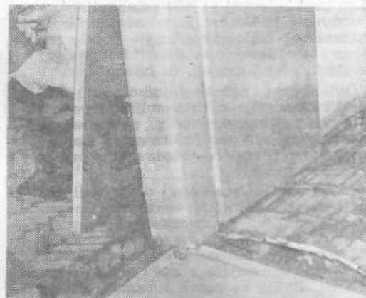
Kdo bo plačal škodo?

● Vroče besede prizadetih so seveda razumljive. Tega so se zavedali tudi na šišenski občinski skupščini, kjer so sklicali sestanek s predstavniki Vodne skupnosti Ljubljana—Sava, krajevne skupnosti in tovarne Rašica. Čeprav je po uvodu tovarišev iz Vodne skupnosti kazalo, da so Gameljčani pač zaradi pomanjkanja sred-