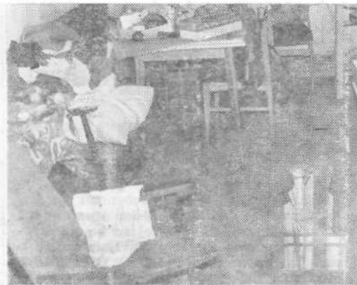
Luže v sobi...

Gameljščice. Prej takšne naloge zaradi pomanjkanja ljudi, ki se spoznajo na urejanje neubogljivih vod, ni moč opraviti. Zato pa bodo že do junija s stroji očistili strugo v najbolj kritičnem delu (približno 500 metrov) ter tako povečali pretok. Znižati bo treba tudi jez ob Juvanovem mlinu ter odstraniti razpadajoči most, ki je bil nekdanj last tovarne Rašica.