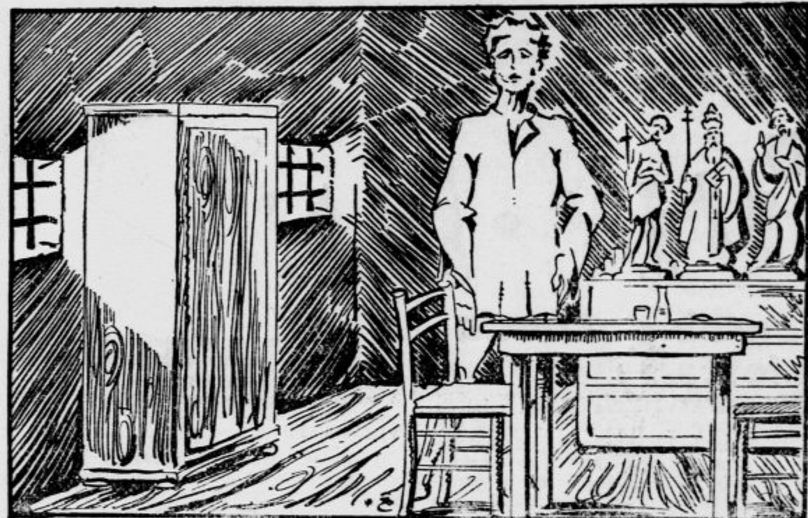
Pogled v njegovo izbo

»Meni se pa že takrat, se reče, preden se je zaprl, ni zdel pri pravi pameti.« je