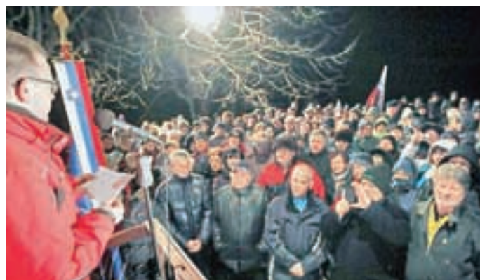
Na dan samostojnosti in enotnosti se je tudi letos na Sv. Jakobu zbrala množica obiskovalcev.