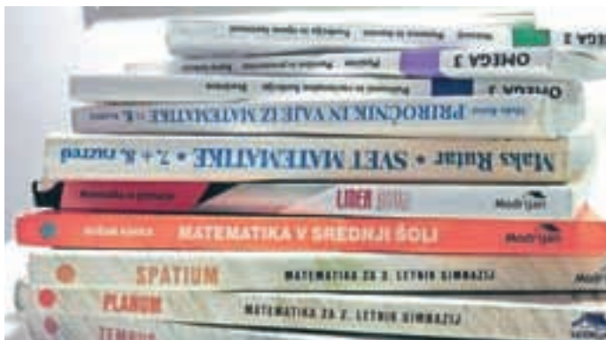
Novost v medvoški knjižnici je brezplačni matematični kotiček.

Po novem je za izposajo gradiva v medvoški knjižnici treba plačevati članarino. Knjižnično gradivo bo še naprej na voljo brezplačno otrokom, brezposelnim in invalidom.