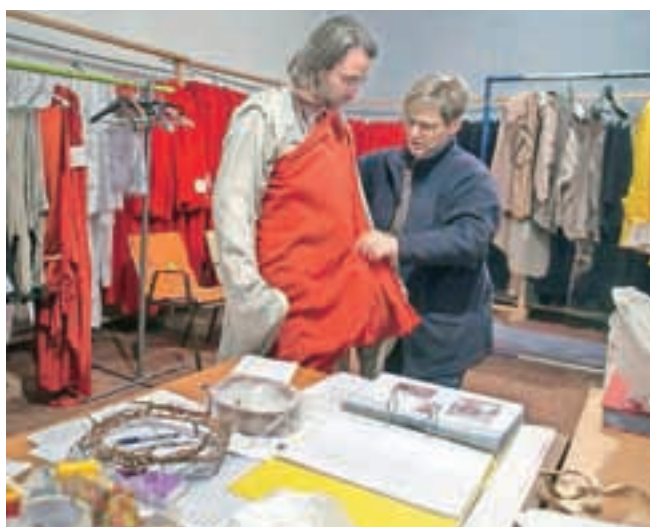
Še zadnje priprave na Škofjeloški pasijon