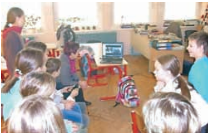
Učenci se srečujejo preko video konferenc.

V osnovni šoli Preska so v letošnjem šolskem letu v okviru programa Erasmus+ začeli izvajati projekt MORE – Mobilna sredstva v izobraževanju: učimo se skupaj.