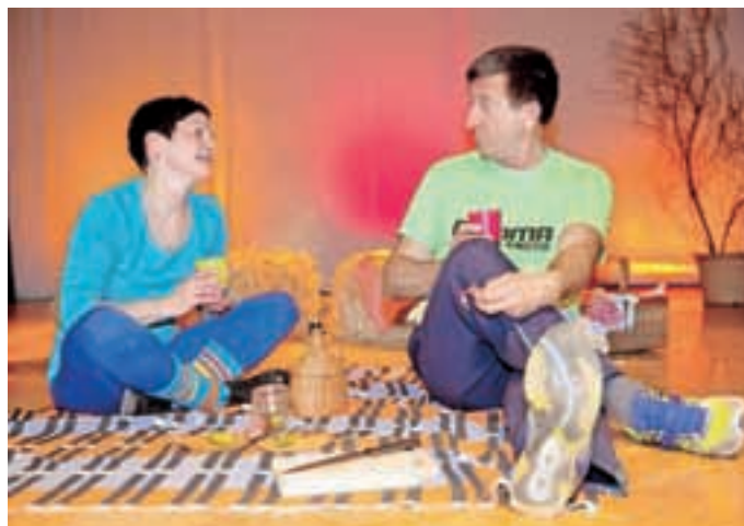
Na pikniku je pikanje salame in kumaric v drugem planu.