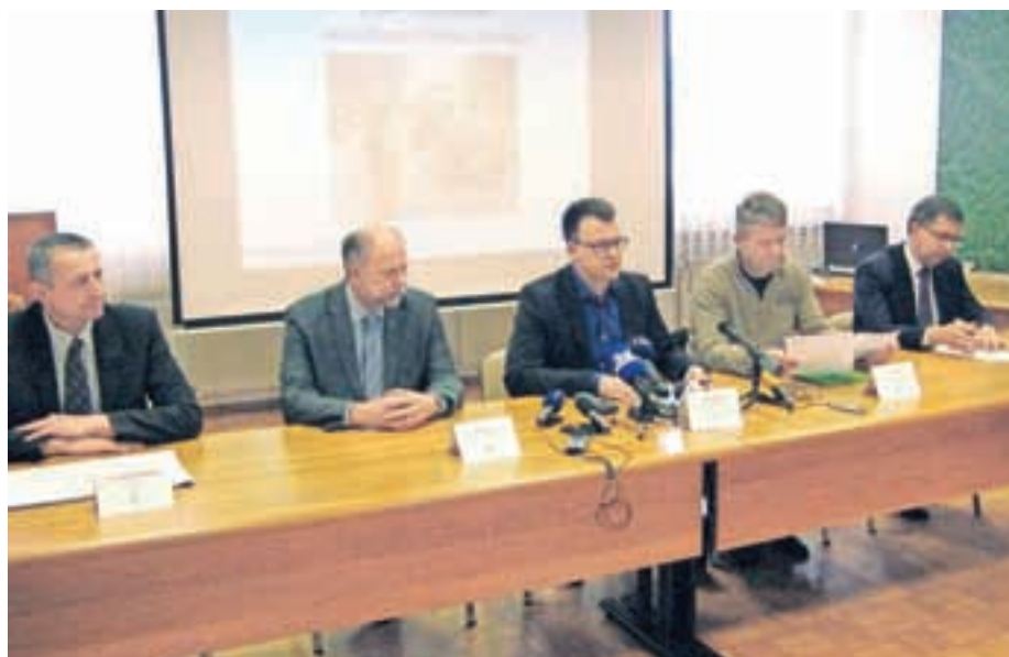
Župani občin Medvode, Škofja Loka, Gorenja vas - Poljane, Žiri in Železniki so se skupaj zavzeli, da se najde rešitev za eno največjih prometnih težav na Gorenjskem, most v Mednem.

Čeprav je medvoška občina najbolj na udaru, pa uvedbo enosmernega prometa čez most