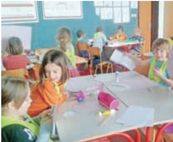
Najmlajši učenci so v lutkovnih delavnicah sami izdelali lutke.

Zgornje Pirniče – Program, s katerim so uspešno kandidirali na razpisu Javnega sklada RS za razvoj kadrov, so poimenovali Dvanajsta šola in zajema široko paleto aktivnosti, ki spodbujajo razvoj intelektualnih, psihosocialnih in umetniških veščin pri učencih. Projekt vodi