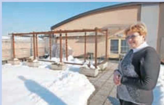
Na delu terase v drugem nadstropju bodo uredili zimski vrt.