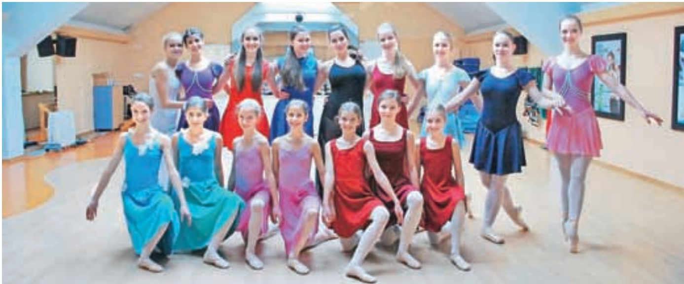
S priprav na nedeljsko tekmovanje

Izbirno tekmovanje za Slovenijo za Dance World Cup so organizatorji letos že tretjič zaupali Baletni šoli Stevens.