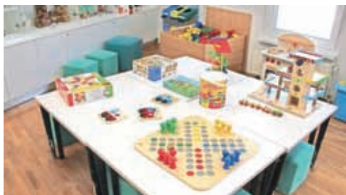
V pravljčni sobi se vsak prvi četrtek v mesecu odvijajo Medvodkove igralne ure.