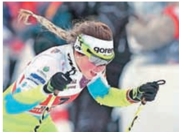
Anamarija Lampič je najobetavnejša smučarska tekačica.