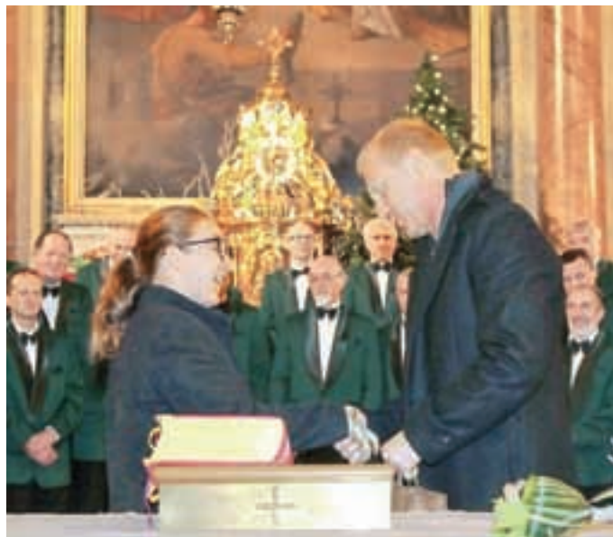
Zbor iz Galicije, v ospredju pa predsednica sveta KS Smlednik in predsednik sveta KS Galicija