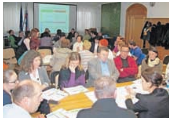
V Medvodah so sredi januarja pripravili predstavitev delavnico LAS v mojem kraju.

Doslej je v Sloveniji delovalo 33 LAS, ki so pokrivale skoraj celotno območje naše države. V njihovem okviru so izvedli različne projekte, ki so prispevali k uresničevanju lokalnih razvojnih potreb, pri čemer so 85 odstotkov njihove celotne vrednosti financirali s sredstvi