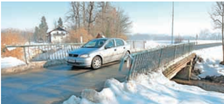
V proračunu so vendarle zagotovili tudi sredstva za obnovo mostu čez Ločnico.