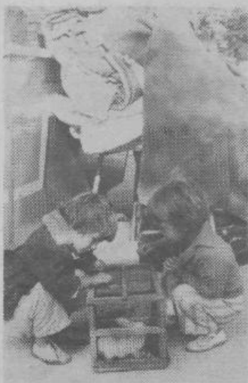
Tale dva nimata urejenega varstva

Kot je znano, so volivci v razpravah o uvedbi samoprispevka za otroško varstvo in šolstvo v Ljubljani zahtevali sprejetje diferenciranih cen v VVZ. Na podlagi te zahteve in upoštevajoč ukrepe o odpravljanju