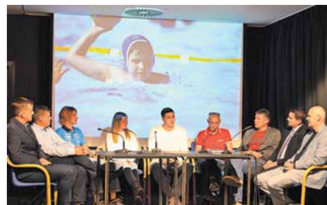
Na praznik slovenskega športa v kamniškem Domu kulture

Večna tema je pokriti bazen, tudi športna dvorana in še bi