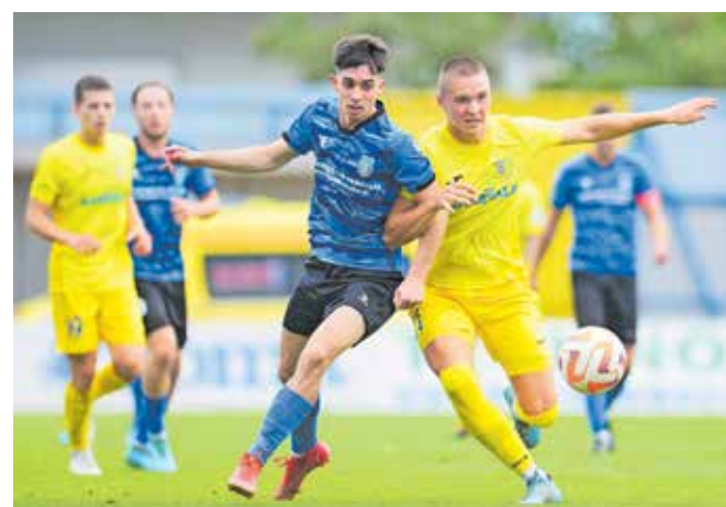
Kamničani so v prvem krogu pokalnega tekmovanja po pričakovanjih izgubili s prvoligašem iz sosednjih Domžal.