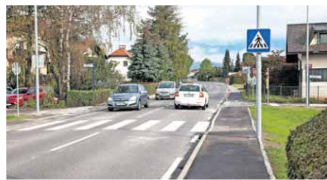
Novi prehod za pešce v Šmarci / FOTO: ALEŠ SENOŽETNIK

Hkrati pa na občinski upravi načrtujejo tudi ureditev prehoda za pešce tudi v Zagorici nad Kamnikom, pod cerkvijo v bližini Osnovne šole Stranje, s čimer bodo poskrbeli za varnost pešcev, predvsem pa varnejšo pot v šolo. Skupna vrednost investicij v oba prehoda za pešce bo znašala nekaj manj kot sto tisoč evrov.