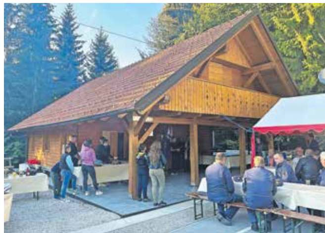
V brunarici na športnem igrišču Laseno je KS Pšajnovica dobila svoje prostore.