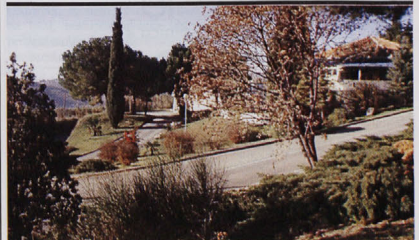
V petek, 17. decembra bo na vrsti prostorska konferenca o PUP Belvedere.