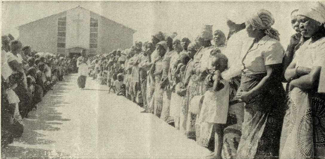
Verniki ob cerkvi sv. Kizita pričakujejo nadškofa

“Tu sem že od letošnjega maja. Prispela sem iz Vietnama. Vrata za Indijo, kamor sem bila namenjena, so se mi zaenkrat zaprla. Ker tudi nekatere dežele v Afriki postajajo teže dostopne za tujce, mi je kongregacija dala dovoljenje, da se pozanimam pri vas glede možnosti dela v Zambiji. Delala sem anesteziologijo dvanajst let.