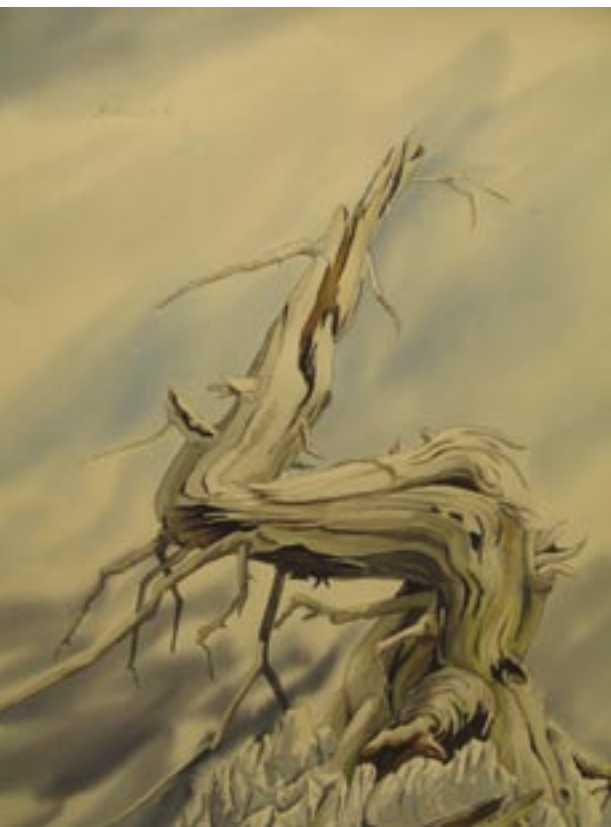
Cene Griljc, Lotse, olje na platnu