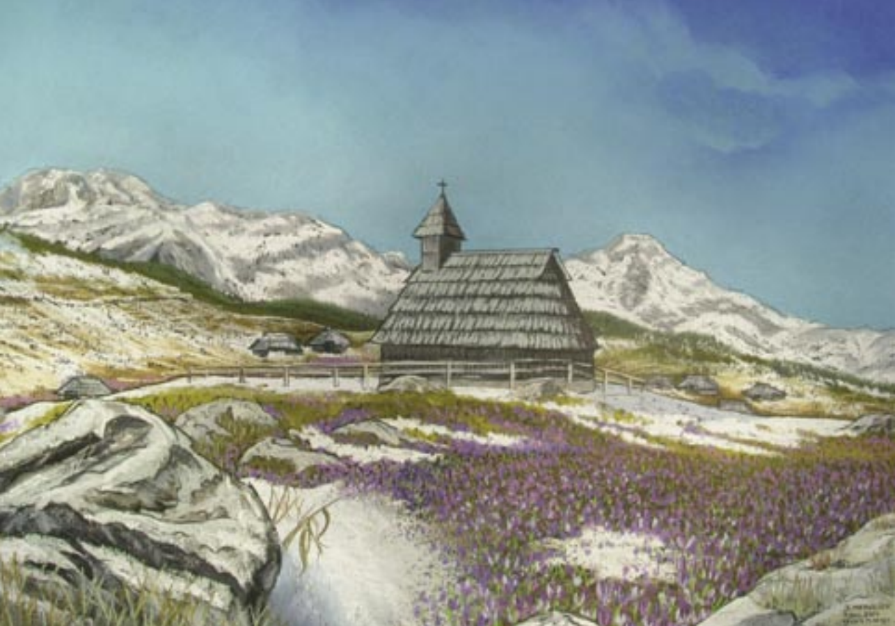
Janez Medvešek, Velika planina, pastel