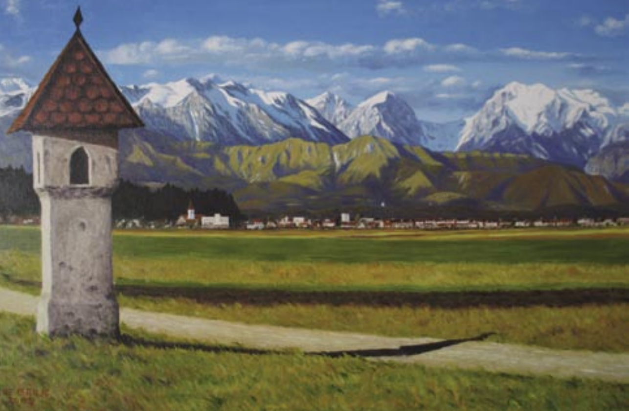
Cene Griljc, Kamniške planine z Mengeškega polja, olje na platnu