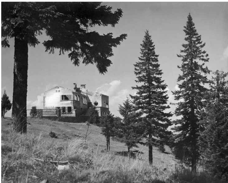
Slika 5: Ostanke Hutterjeve počitniške hiše na ribniškem Pohorju, požgane med 8 in 9. oktobrom leta 1942. Avtor in datum fotografije nista znana. PAM, Pogorišče Hutterjeve vile Ribn. koč, fond: Planinsko društvo Maribor Matica 1928–1999, sign.: SI_PAM/1237, AŠ 28. (Elektronska obdelava: mag. Gerhard Angleitner.)

Prosti čas je preživel na sprehodih po Pohorju, tako izkazoval ljubezen do narave in bil blizu tega, kar danes imenujemo okoljska osveščenost , zlasti še če upoštevamo, da je sprva začel kot lovec, kaj kmalu pa se je posvetil sprehajanju po pohorskih gozdovih, pozimi turnemu smučanju v okolici svoje počitniške hiše in fotografiranju v naravi. 205