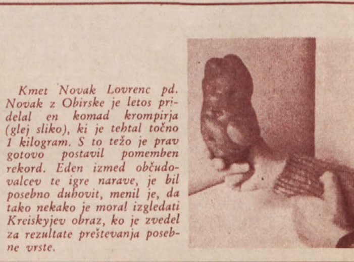
Kmet Novak Lovrenc pd. Novak z Obirske je letos pridelal en komad krompirja (glej sliko), ki je tehtal točno 1 kilogram. S to težo je prav gotovo postavil pomemben rekord. Eden izmed občudovalcev te igre narave, je bil posebno duhovit, menil je, da tako nekako je moral izgledati Kreiskyjev obraz, ko je zvedel za rezultate preštevanja posebne vrste.