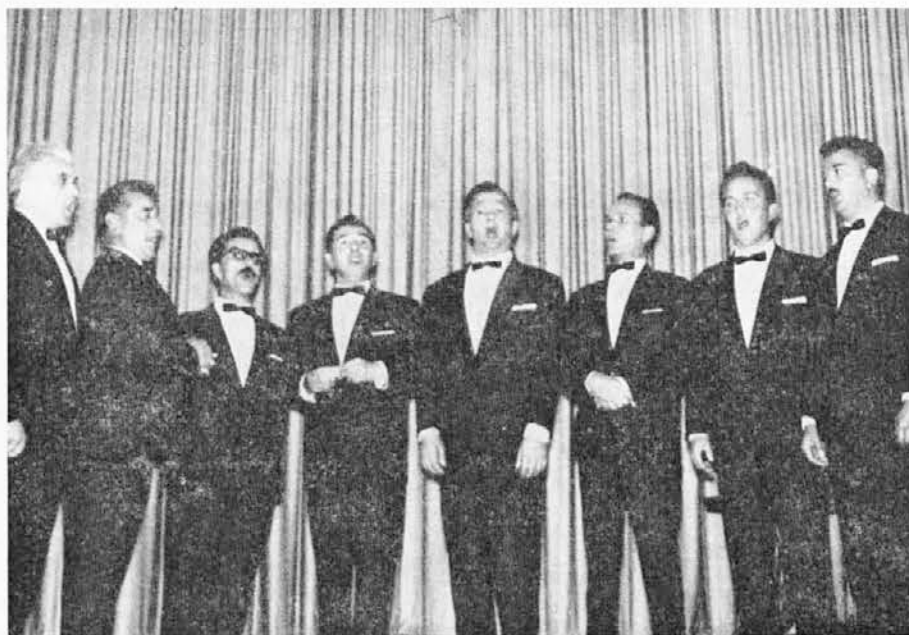
Slovenski oktet iz Ljubljane na odru Katoliškega doma

Zadnji del, ki je obsegal pesmi tujih narodov, je otvorila italijanska narodna »La Montanara«, ki je bila zelo posrečeno podana. Sledila je slovaška »Ej hora, hora«, kjer smo zlasti občudovali vse glasovne fineše. Zelo toplo je nato občinstvo sprejelo črnski pesmi »Swing low sweet chariot« (duhovna) in »You better mind«, kjer smo prav živo doživljali otožna in vesela čustva ameriške črnske duše. Pravi plebscit pa sta doživeli ruski narodni »Dvanajst razbojnikov« s krasnim basom solo in »Pesem o atamanu Platovu«. Prva je polna verskega razpoloženja s presečo melodijo, druga pa epskega značaja in je kosaške vsebine. V harmoniji glasov (celote kot izrazitih solistov) je prav zaživel ruski človek. Izven sporeda je Slovenski oktet izvajal še koroško »Ah ti puobič...« in svojo »klasično« »Ribniško«, ki je v dvorani že pri prvih akordih sprožila pravi val navdušenja.