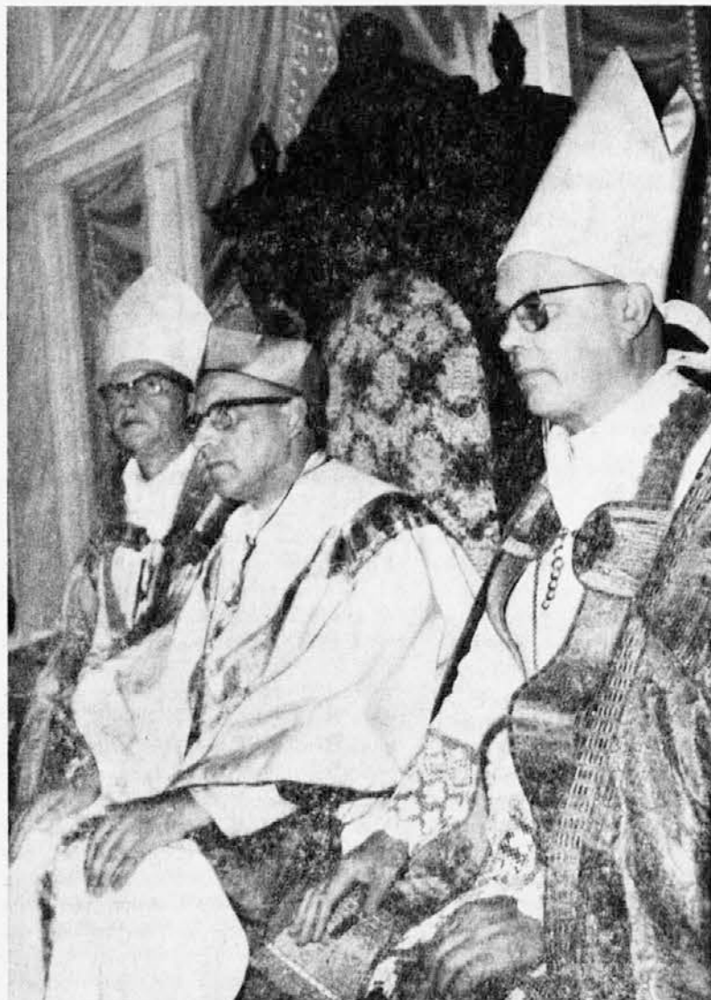
Š slovesnosti škofovskega posvečenja v Logu

Italija šteje 280 škofij. Največja je milanska, ki šteje nad tri milijone ljudi. Na drugem mestu je rimska škofija z dva milijonoma ljudi. Na splošno so v severni Italiji škofije večje kot v južni. Najmanjše škofije so v Markah in v Umbriji, ki imajo povprečno po 65.000 ljudi. Če vzamemo celo Italijo, pride povprečno na škofijo 182.000 vernikov. Škofje so povprečno precej stari. Le sedem je mlajših od petdeset let, vsi drugi so starejši. Povprečna starost je 65 let. Najstarejši škof je v Gaeti in ima 95 let. — Koncil je zelo priporočil reorganizacijo škofij, ki naj bi ne bile številčno promajhne. V prihodnjih letih je pričakovati, da bo prišlo do precejšnjih sprememb v italijanskih škofijah.