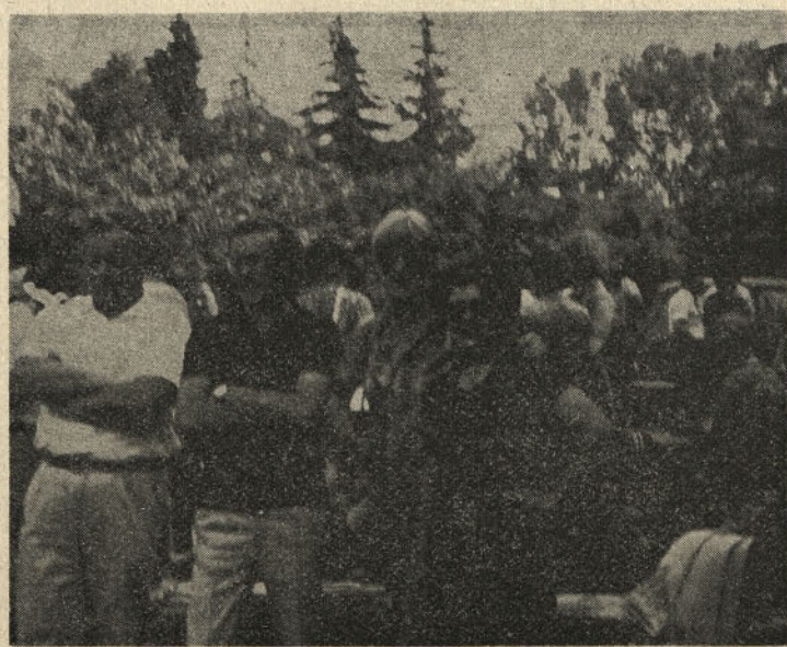
Prijatliji veseli vsi