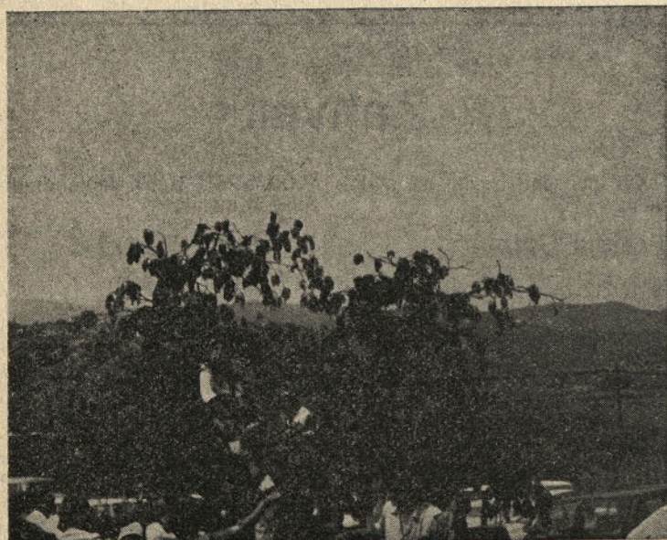
in še češnje sadil,