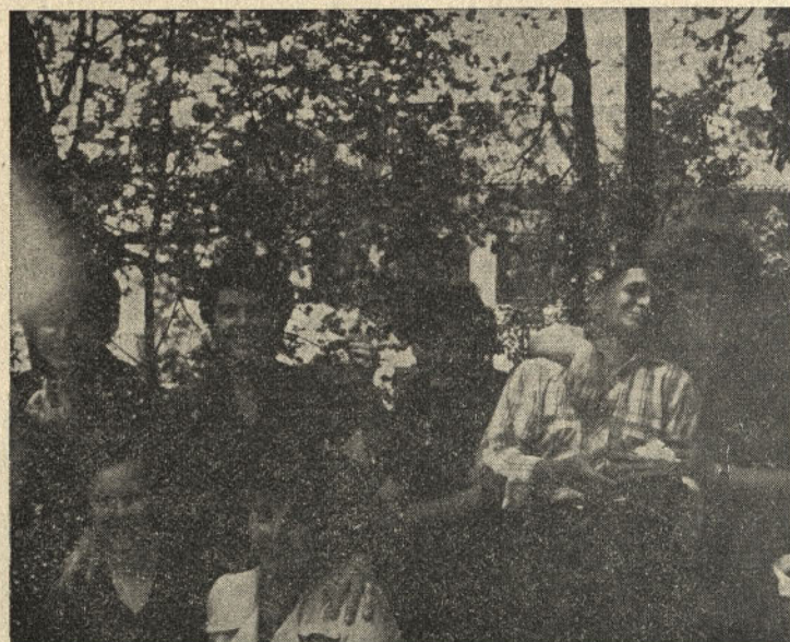
še sam ga bom pil.