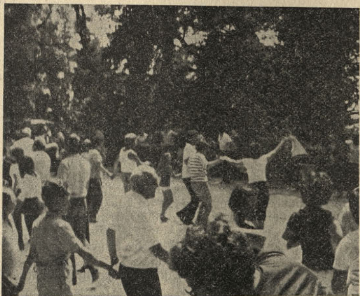
po pesmi in plesu