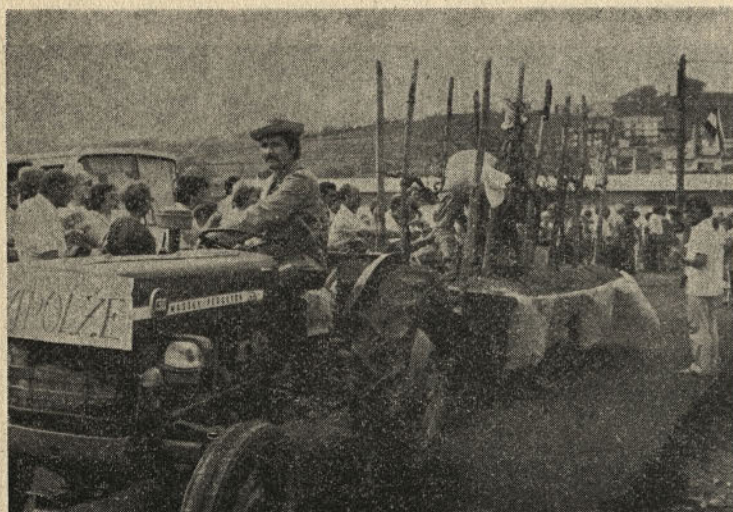
En hribček bom kupil...