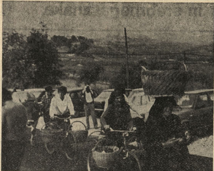
Češnje so rodile

Svet za preventivo in vzgojo v cestnem prometu