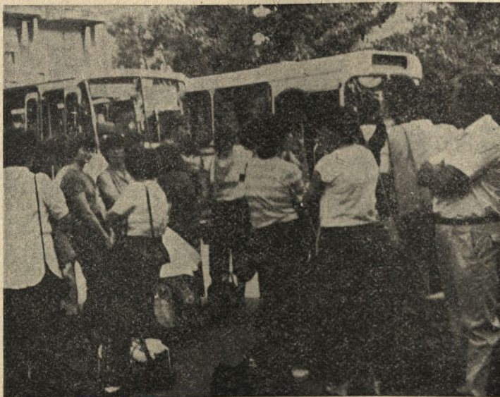
prišlo je slovo.