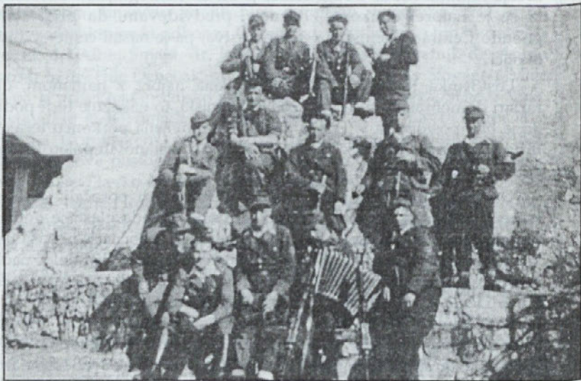
Gorenjski domobranci na Šmarni gori. April 1945