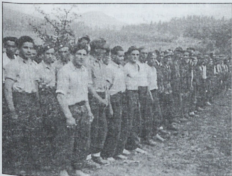
Škofjeloški domobranci — Vetrinje, maj 1945

Še odločneje smo namerili korake za smer proti Italiji, kar nam se je po dolgem tavanju posrečilo. Bili smo med svojimi in na varnem!