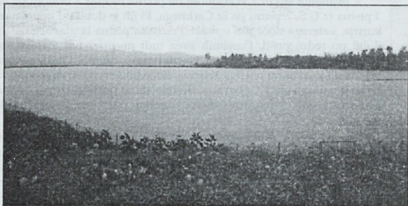
Teharje — potopljeno hrepenenje