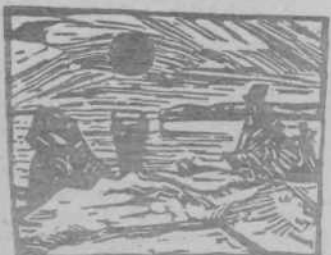
Erich Heckel: Rajstvo sonca. 1914