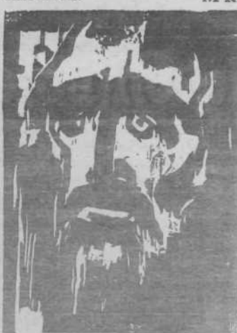
Emil Nolde: Pevci. 1912