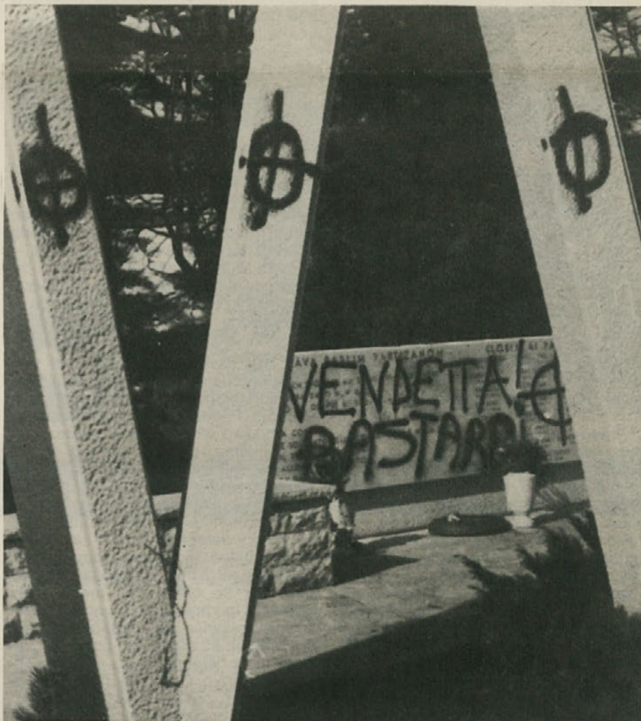
Na Proseku so običajni neznanji mazači zopet pokazali kako obširna je njihova kultura. Domače prebivalstvo in razne kulturno-politične organizacije so odločili, da tokrat ne bodo napisov in znakov za nekaj, časa zbrsali in da bodo ob vznožje spomenika postavili ploščo z napisom «To je fašistična kultura». Protestna manifestacija bo v nedeljo, 27. ob 10.30

temu, da se enotno ohrani obstoj slovenske narodne skupnosti tako z gospodarskega, kakor tudi družbenega, jezikovnega in kulturnega vidika, še posebej, kar zadeva nadiško, tersko in rezijansko dolino. V tem okviru poudarjajo tudi pomen ponovne opredelitve mešane italijansko-jugoslovanske industrijske cone, ki jo predvidevajo osimski sporazumi, vzdolž celotne meje.