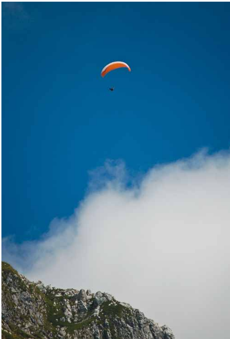
Slika 1. Jadralni padalec nad Rdečim robom nad dolino Tolminke (, 25. 8. 2009).