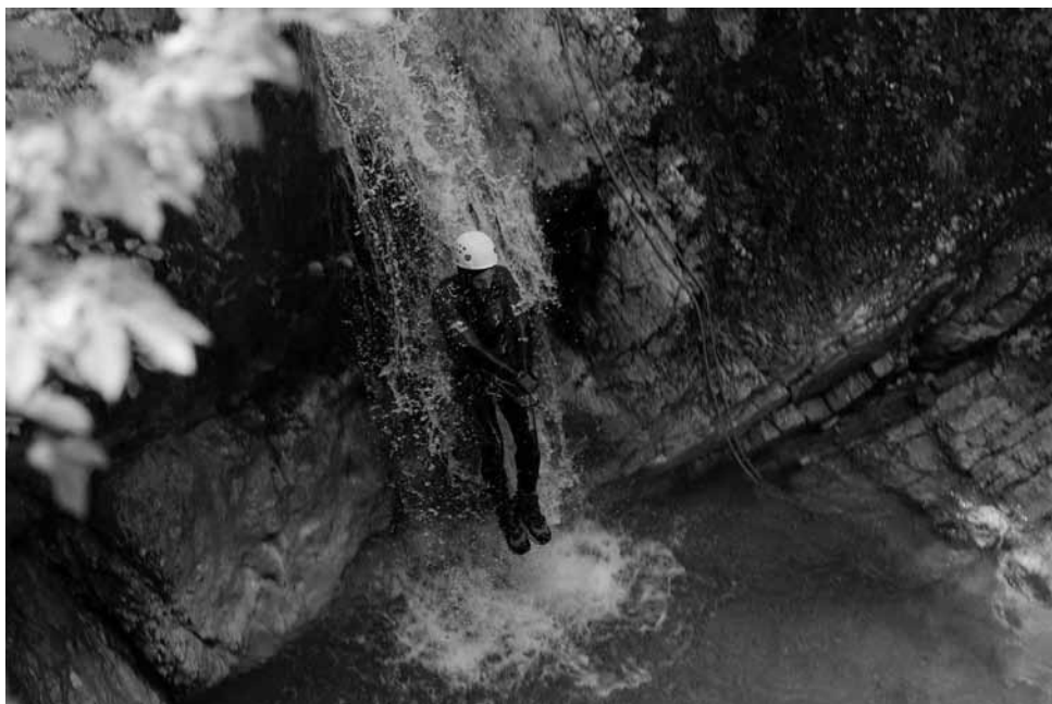
Slika 3. Soteskanje v Fratarici. Dolina Koritnice pod Mangartom (, 2. 8. 2011).