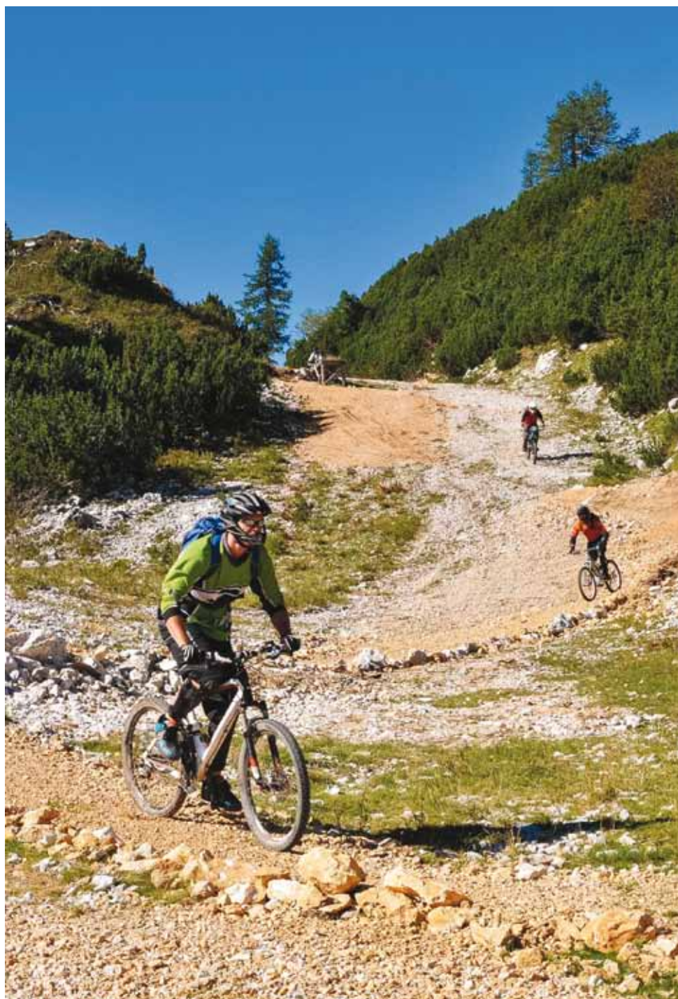
Slika 2. Gorski kolesarji na progi za spust na Voglu.