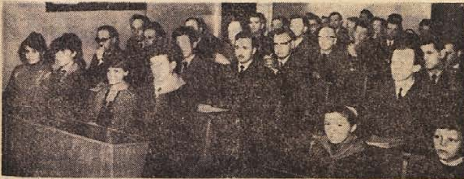
24. marca je imela občinska skupščina Ribnica slavnostno sejo v počastitev občinskega praznika. Delu seje so prisostvovali tudi pionirji, ki so prišli odbornikom čestitat za praznik

Nedvomno so to precejšnja sredstva, ki jih bodo morali občani ribiške občine zbrati, je pa edini način za ureditev šolstva v občini. Pouk bo namreč lahko uspešen le v sodobno urejenih prostorih, česar sedanjim šolam najbolj primanjkuje. Ne le zaposleni, samopriskavek bodo morali poslej plačevati tudi kmetje in obrtniki, prav tako pa tudi pripadniki JLA in milice, ki ga zadnji dve leti niso plačevali.