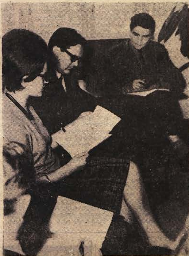
Posnetek z medobčinskega posvetovanja predsednikov in sekretarjev komitejev ZMS, kjer so se dogovorili o sodelovanju pri posameznih akcijah. Več o tem v sestavku »Spoznavati sosede« na 5.strani.