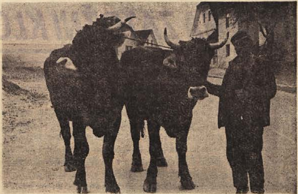
»SEJM BIL JE ŽIV. PRODAL I ON JE LAHOM TAM PAR VOLOV...« Tako bi gor njo fotografijo morda naslovil pesnik Anton Aškerc — naš sodelavec Franc Modič pa nam je poslal z njo vred naslednji podatek: kmetje z Blok najraje kupujejo dobre vole na Bučki. Tudi kmet na sliki jih je kupil, pot od Bučke do Blok pa je precej dolga in naporna. Par volov in junega novega lastnika je naš fotograf srečal, ko so šli skozi Velike Lašče.

surovin so previsoke v primerjavi s prodajnimi cenami izdelkov. Prodajne cene so že dolgo »zamrznjene«, ker pa se proizvodni stroški povečujejo, obrat ne ustvari potrebnega dohodka. Trenutno živi v upanju, da bo zveza gospodarska zbornica le uveljavila svoj predlog, naj bi se prodajne cene uskladi-