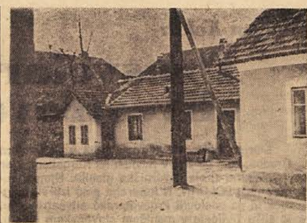
Delavnica Tineta Bajca v Kostanjevici, kjer so bili že pred vojno partijski sestanki in leta 1941 javka Osvobodilne fronte za Kostanjevico.

Ko so obravnavali še druge letošnje naloge organizacije, so sklenili, da je potrebno letos zdravstveno pregledati vse borce kmete in tiste borce, ki imajo priznano dvojno delovno dobo. Prav tako bodo letos popisali vse