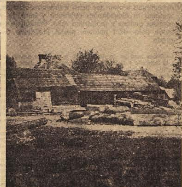
KUSLJANOVA ŽAGA v Sentjerneju je bila od 1941 do 10. marca 1942 skladišče orožja. Od tam je odšla tretja skupina šentjernejskih fantov 10. marca 1942 v partizansko šolsko taborišče na Rdeči kamen. Na Gorjance so se fantje vrnili že 29. marca 1942 in ustanovili Gorjanski bataljon.