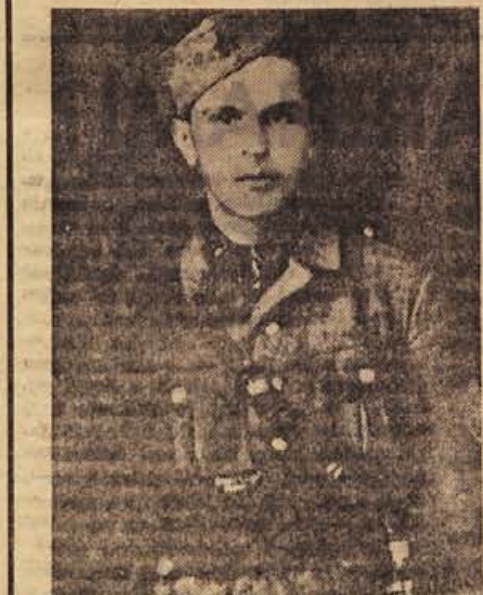
Narodni heroj Jože Kadunc-Ibar je bil priljubljen in spoštovan partizanski borec in sposoben komandant