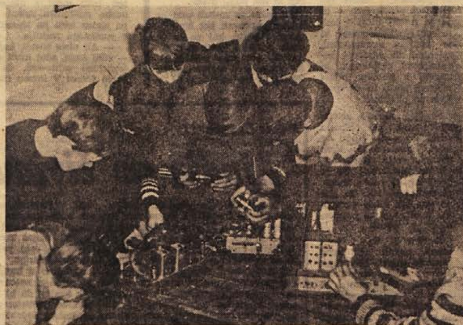
TAKOLE SE POGLEBLJAJO V SVET ZNANOSTI IN TEHNIKE mladi radioamaterji kostanjeviške osnovne šole