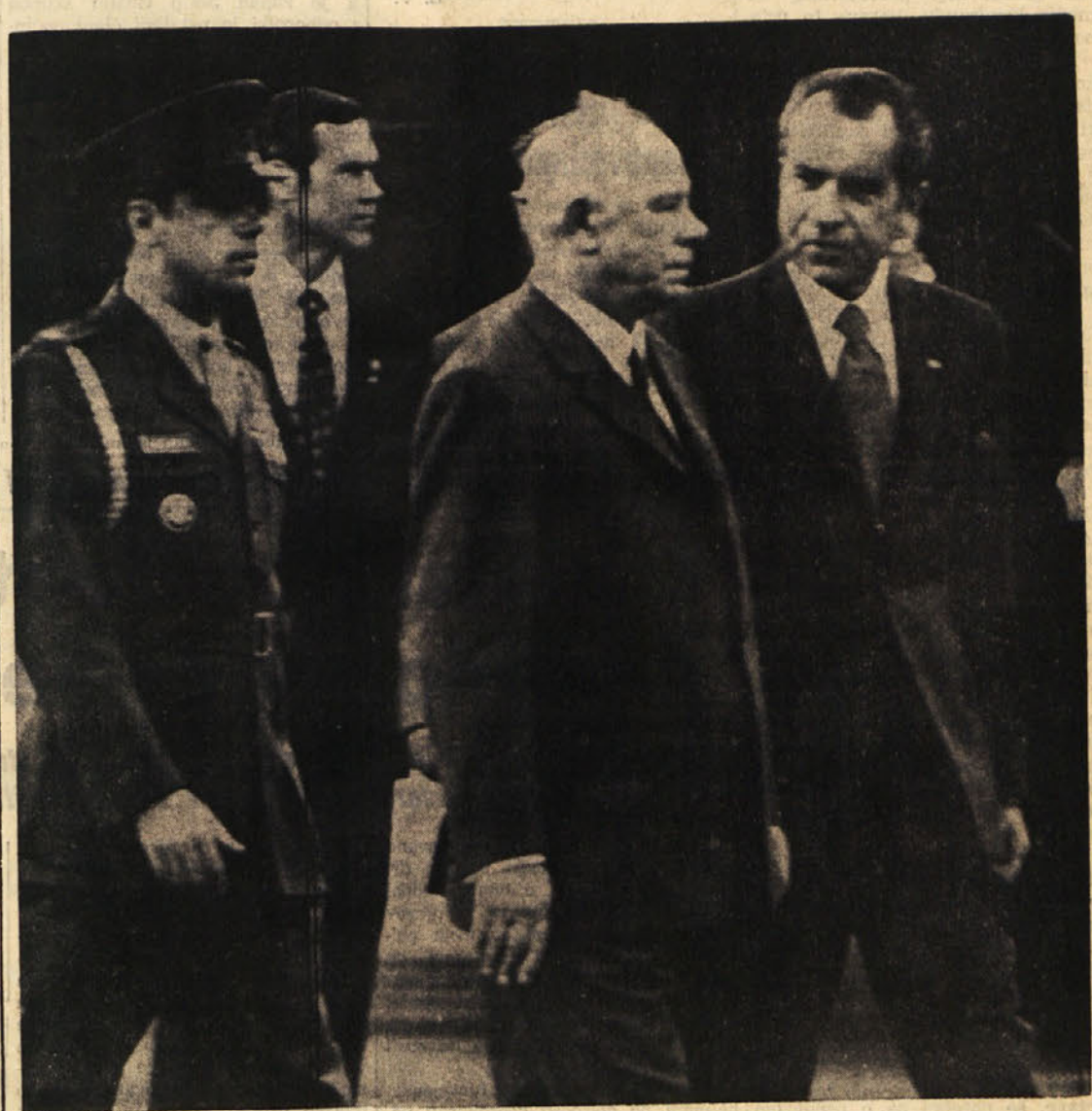
Nixon (desno) v pogovoru s sovjetskim predsednikom Podgornim na moskovskem letališču v Vnukovu

Nguyen Thi Binh je še dejala, da Nixonovi pogovori v Moskvi ne bodo v ničemer vplivali na stališče ZRV: »Naše stališče ostane nespremenljivo. Spor je treba rešiti med vietnamskim ljudstvom in ZDA.«