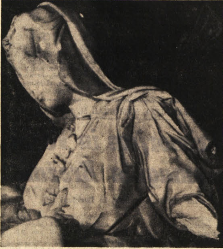
Poškodovani kip «Pietà»

V verskih krogih menijo, da ne gre samo za poškodbo umetnine, temveč za pravcato oskrunjenje.