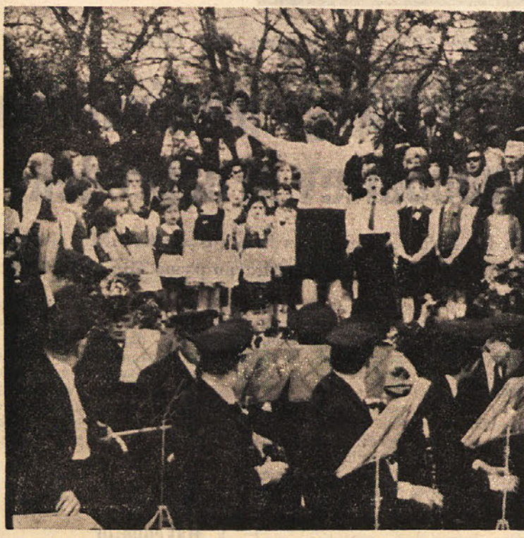
V nedeljo popoldne so imeli v Mačkoviyah gpraznik česnja. Te že tradicionalne pridelave se je udeležila precejšnja množica.