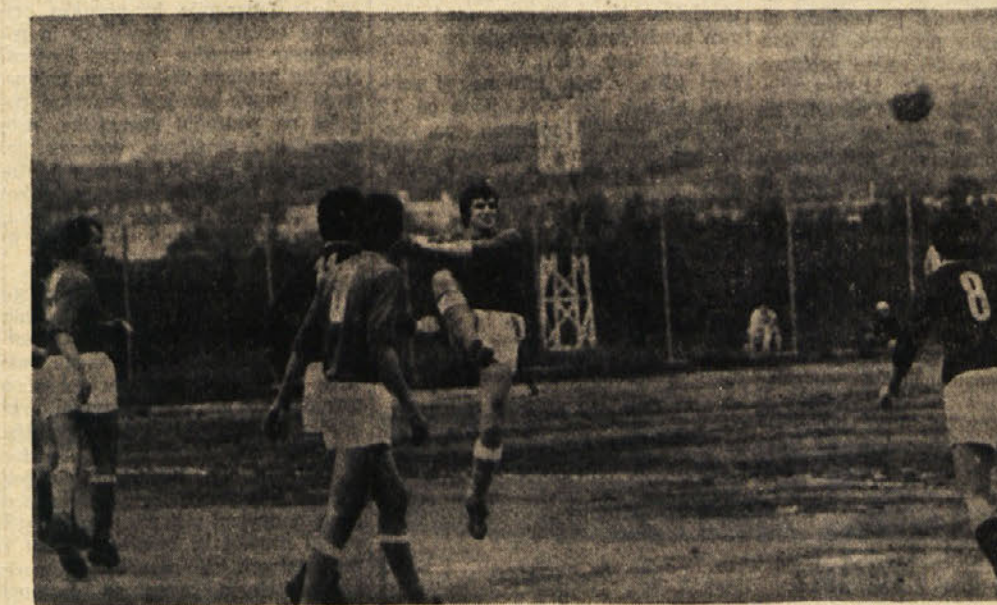
Primorje — Vesna: ta derbi se je končal z remijem