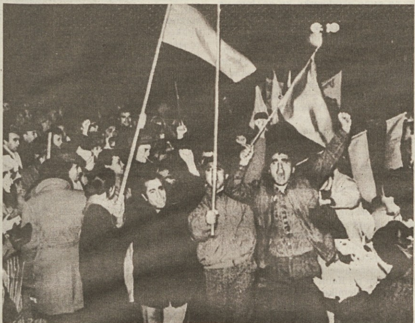
Tudi v gruzijskem Tbilisiju so bile množične manifestacije Armencev

Protislovni podatki o številu mrtvih - Nov dramtičen poziv Mihaila Gorbačova k narodni spravi Teheran že govori o sovjetsko-zahodni zaroti - Nahičevanska ASSR se je odcepila od Sovjetske zveze