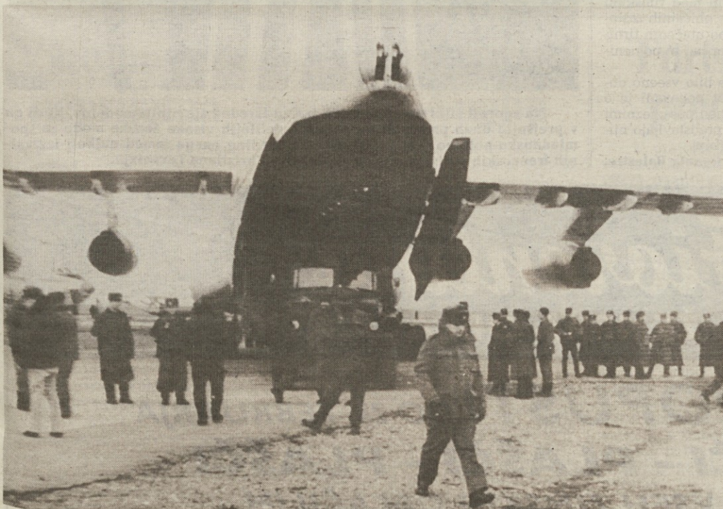
Iz orjaških vojaških transportnih letal prihajajo v Zakavkazje ojačena