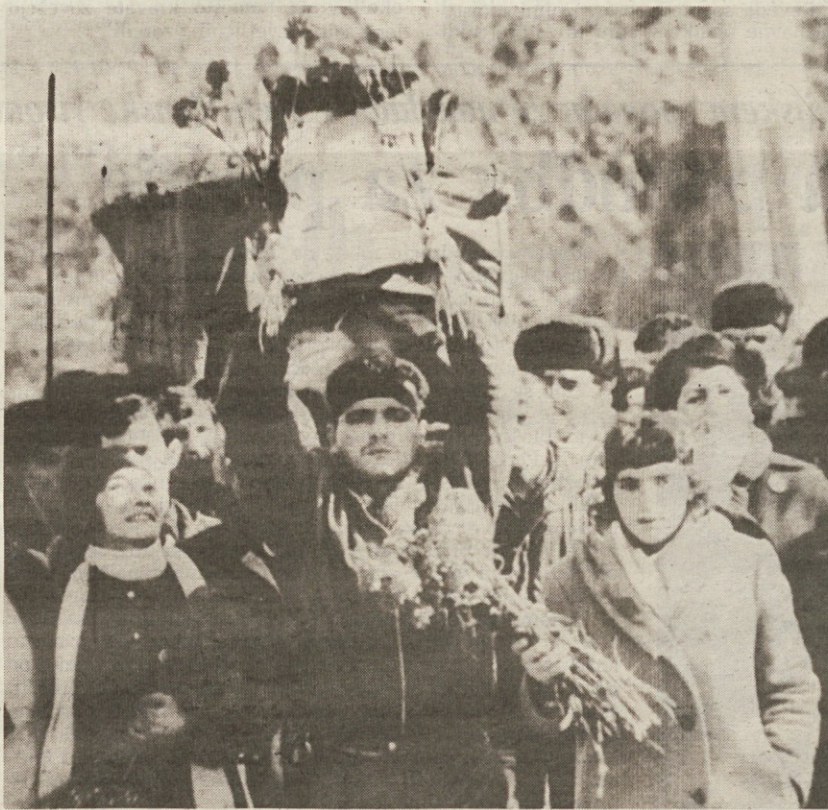
Pogreb v spopadih ubitega Azerbajdžanca

Z Azerbajdžanci pa je imel Stalin daljnosežne načrte, ki jih je razkril v drugi svetovni vojni, ko je zasedel perzijski Azerbajdžan in vsestransko podprl domače nacionaliste, ki so se hoteli ločiti od Perzije. Sovjetske čete so južni Azerbajdžan zapustile šele leta 1946.