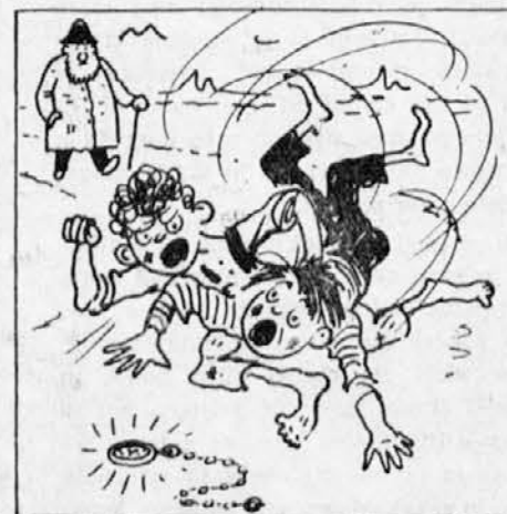
Tuj mož od daleč vidi prepír, se ustavi: naredu bo mir.