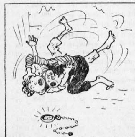
Potlé puobča z rokami u laseh, se jezno vajata an tučeta na tieh.