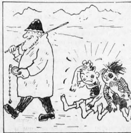
Zatuo, kjer se prepirata dva, mož porče: »trećji dobiček ima!«