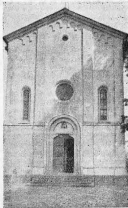
STARA CERKEV V ČENEBOLE

V nekem zapisku iz leta 1604 čitamo, da je Čenebola vas, kjer so hiše pokrite s slamo in da se morajo prebivalci preživljati s sečno drvi in žganjem oglja. Danes hiše niso več pokrite s slamo, vendar pa je življenje v vasi morda še bolj trdo