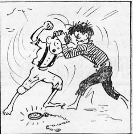
Za lase sadá ulče parjatelja Tinček an na pomuo? kiče na glas Vanček.