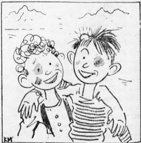
Ure nje več, zakl sadá še prepír? Puobča dasta si rokò an napravita mir.