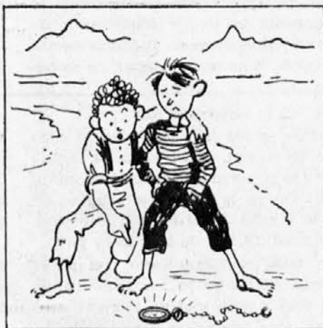
Pa kar se ustavita: ura na tieh! Vesejé se puobčem kaže u očeh.