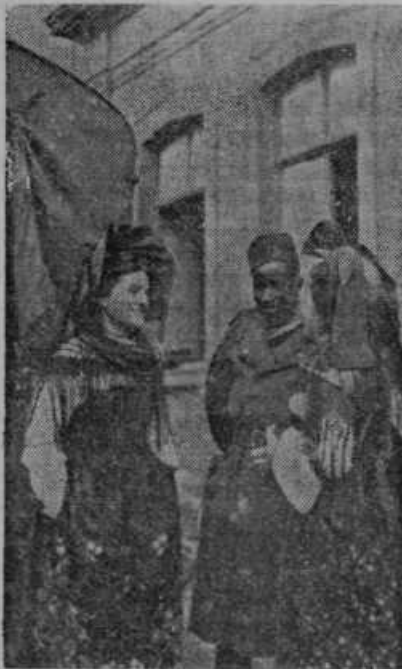
Mladi Abzacanki v razgovoru s francoskim vojakom iz Afrike