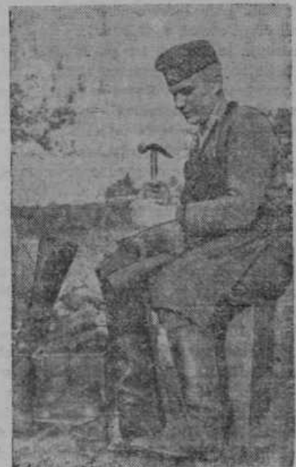
Nemški čevljar na fronti