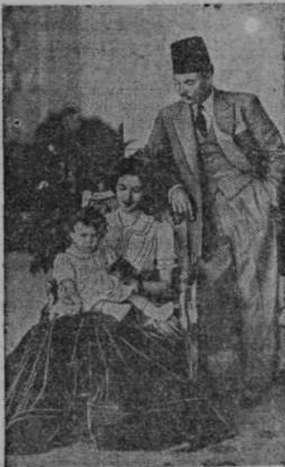
Egiptovski kralj Faruk s kraljico in hčerko

Št. Ij pod Turjakom. Dne 26. novembra je bil za našo župnijo dan veselja, ko so prvič v našem novo zgrajenem »Slomšekovem domu« nastopili naši fantje in dekleta. Fantje in dekleta! Lepo ste izvajali vse točke, ki so bile na sporedu. Vsa župnija, deloma ves okraj, ki je bil navzoč po svojih zastopnikih, vam je častital k vašemu uspehu. Naš »Slomšekov dom« naj služi predvsem tebi, draga mladina, da se boš v njem vzgajala duševno in telesno, da boš v njem izklesala značaje za svojo bodočnost. Mi odrasli vas bomo vsepovsodi podpirali pri vašem delu, tako da našo faro dvignemo versko, kulturno in gospodarsko. Naš »Slomšekov dom« naj služi temu namenu. So nekateri, ki naš dom nekoliko postrani gledajo, češ kaj je doma treba, naj bi se rajši gradila ubožnica. Vsem tem povemo, da naj začnejo graditi ubožnico in mi vsi, ki smo