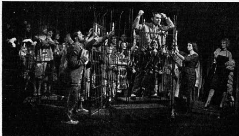
Brecht - Weill: »Opera za tri groše«. Prizor v ječi.

Ta jubilejna revija ni tekmovanje. Toda tudi že sama udeležba na njej predstavlja vsakemu udeležencu veliko moralno priznanje. Dobro je, da je bila tudi Torkarju, prav tako kot titograjskemu ansamblu dana možnost, da ob tej priložnosti dobita tako priznanje.