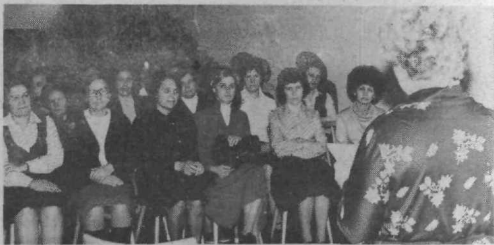
8. MAREC V TIP-TOPU – V tristoosemdesetčlanskem kolektivu Tip-top, ki sicer spada pod novomeški Labod, so osmega marca praznovali dan žena in praznik celotnega Laboda obenem. Da je temu tako, so se odločili, ker ima Labod med 2000 zaposlenimi ker 1500 žensk. Kulturni spored ob dnevu žena so pripravili učenci gimnazije Ivan Cankar, istočasno pa so podelili tudi priznanja ženskam-delavkam za deset, dvajset in več letno sodelovanje v kolektivu.