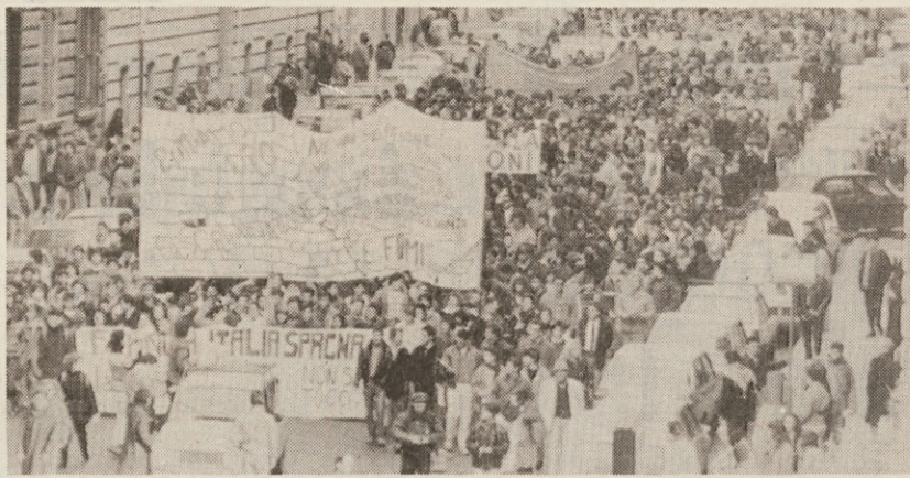
Eden izmed včerajšnjih sprevodov rimskih višješolcev

Rimski manifestaciji pa nista bili edini študentski demonstraciji včerajšnjega dne. V Bologni, kjer je KD sklicala vsedržno konferenco o šolstvu, se je na trgu pred sedežem konference zbralo kakih tisoč dijakov, ki so izrazili svoje nezadovoljstvo z lučanjem jaja.