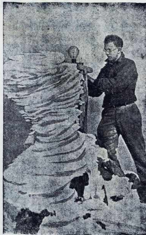
Znanstveno preiskavanje v večnom lédi.