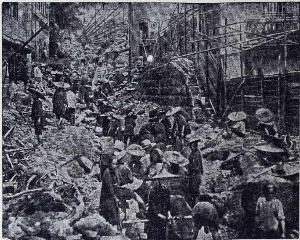
Slika nam kaže japonsko mesto, štero je bilo od zadnjega potresa popolnoma porüšeno.

Krščanska socialna stranka je jedina štera se bori načelno i dosledno proti fašistovskim poizkusom, zato ne smemo gučati o kakšoj krščansko-socialni diktaturi. Vladni stopaj je napravleni v obiambo resničnih demokratičnih pravic avstrijskoga lüdstva proti vsem načrtom revolucije. V dobrobit očuvanja mira v državi bi bilo želeti, da bi stopaj ministerskoga predsednika Dollfussa pripelao do razčiščenja temnoga političnoga ozračja, ki visi nad avstrijskov državov.