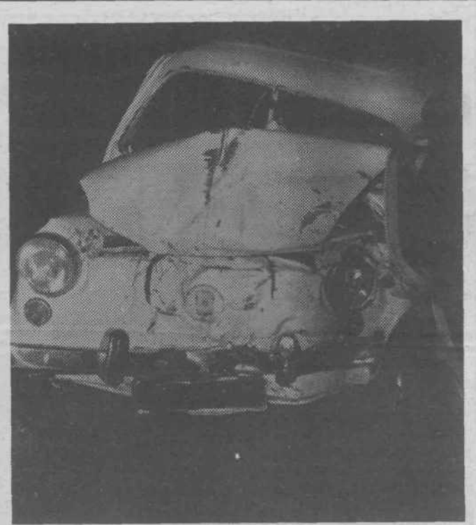
Tudi to pot je bil vzrok nesreče alkohol, povod pa neprimerna hitrost

○ NAJPOGOSTEJŠA POVZROČITELJA PROMETNIH NEZGOD