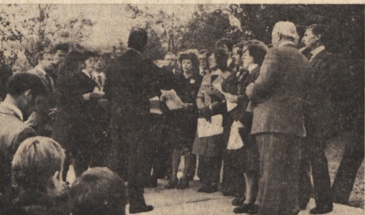
Mešani pevski zbor iz Mačkolj