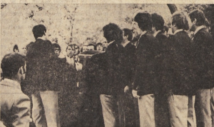
Moški pevski zbor «Valentin Vodnik» iz Doline