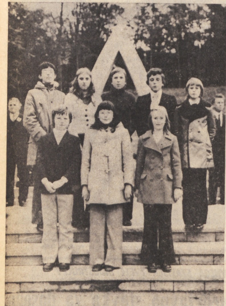
Mladi recitatorji ob odkritju spomenika v Mačkoljah