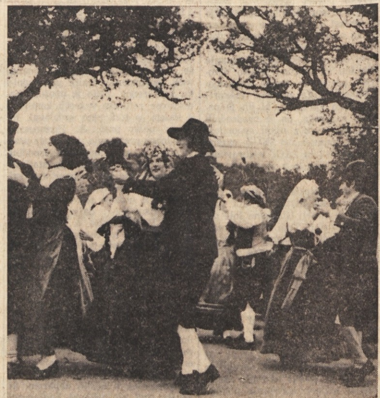
Pod Tabrom so svati zaplesali polko

Tudi šesta Kraška ohcet je za nami. Čeprav vreme ni obetalo nič dobrega, se je v nedeljo le toliko usmiliło zakoncev in njihovih svatov, na desetino narodnih noš in na stotine radovednežev, da vsaj ni deževalo. Tako se je vse odvijalo po programu od tistega odličnega «da» pred oltarjem v cerkvi na Tabru, preko malice pri Furlanu, vzdolž po cesti do Repna, nato še v Kraški hiši, kjer so po starem običaju sprejeli «novico», in nazadnje v Krizmanovi gostilni, kjer se je jelo, pilo in pelo, da je bilo veselo kot v zlatih starih časih. Popoldne je mladi par čakala še ena dolžnost: odpreti sta morala ples ob zvokih «Veselih Gorenjcev», da so se potem lahko zavrteli in stiskali še drugi. Drugo seveda še pride in če ste videli v našem dnevniku objavljene fotografije prejšnjih petih kraških parov, potem so obeči za rast našega rodu kar dobri. Zato tudi naše iskreno voščilo mlademu paru na življenjsko pot. Pa še ugotovitev udeležencev: vino je bilo dobro, štruktiji pa še bolj, škoda le, da so jih tako počasi kuhali