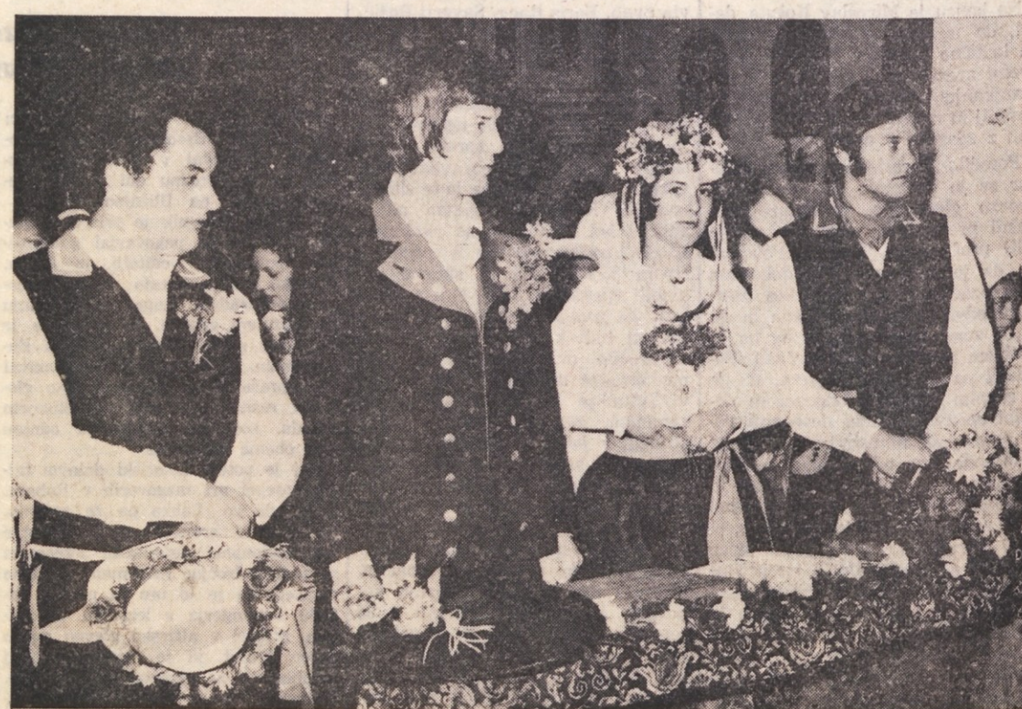
Šesti par Kraške ohceti pred cerkveno poroko na Repentabru