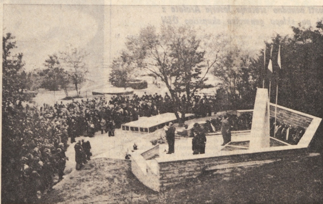
Pogled na spomenik in množico med svečanim odkritjem. Govori dolinski župan

Med redkimi vasi pri nas, ki niso imele spomenika padlim v NOB, so bile do te nedelje tudi Mačkolje, prijazna vas pod socerbsko grajsko gmoto. Sedaj imajo spomenik tudi v Mačkoljah, še najbolj pomembno pa je, da so ga postavili domačini z lastnimi sredstvi. Okrog te akcije se je ustvarila vaška enotnost, kot je bila v času boja za svobodo in tudi svečano odkritje obeležja je izzvenelo v duhu enotnosti in vaške solidarnosti v spominu na prestano gorje, po žige in pokole, v spominu na tiste moze in sinove, ki so v boju žrtvovali svoja življenja. Pa ne le v spominu na preteklost, tudi v današnjem spoznanju, da nam je enotnost še potrebna. Zlasti je bila razveseljiva prisotnost tolikšnega števila domače mladine in njen delež pri gradnji spomenika. Mačkolje so med NOB dale 60 borcev - partizanov in 29 jih je padlo. Tolikšen krvni davek je dala malokatera vas. Tudi brošura, ki so jo ob tej priložnosti izdali, je zgovoren dokument deleža te naše vasice na Tržaškem v skupnem boju slovenskega naroda proti fašizmu.