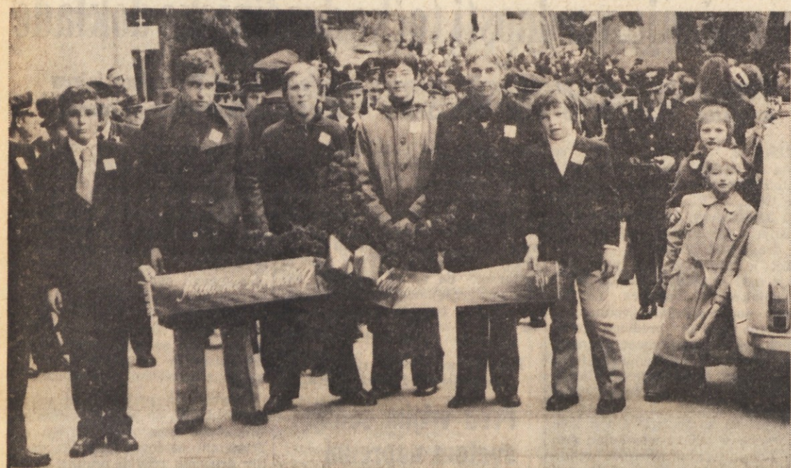
Domača mladina nese svoj venec k spomeniku v boju za svobodo padlim domačinom

Med redkimi vasi pri nas, ki niso imele spomenika padlim v NOB, so bile do te nedelje tudi Mačkolje, prijazna vas pod socerbsko grajsko gmoto. Sedaj imajo spomenik tudi v Mačkoljah, še najbolj pomembno pa je, da so ga postavili domačini z lastnimi sredstvi. Okrog te akcije se je ustvarila vaška enotnost, kot je bila v času boja za svobodo in tudi svečano odkritje obeležja je izzvenelo v duhu enotnosti in vaške solidarnosti v spominu na prestano gorje, po žige in pokole, v spominu na tiste moze in sinove, ki so v boju žrtvovali svoja življenja. Pa ne le v spominu na preteklost, tudi v današnjem spoznanju, da nam je enotnost še potrebna. Zlasti je bila razveseljiva prisotnost tolikšnega števila domače mladine in njen delež pri gradnji spomenika. Mačkolje so med NOB dale 60 borcev - partizanov in 29 jih je padlo. Tolikšen krvni davek je dala malokatera vas. Tudi brošura, ki so jo ob tej priložnosti izdali, je zgovoren dokument deleža te naše vasice na Tržaškem v skupnem boju slovenskega naroda proti fašizmu.