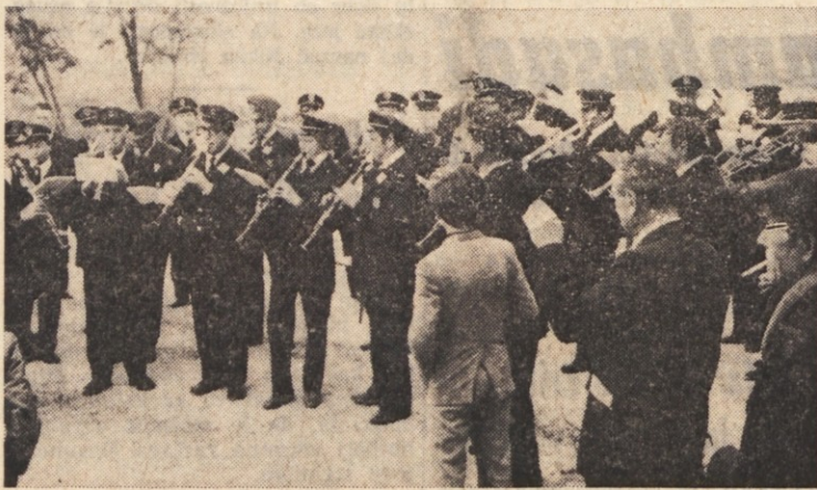
Godba z Brega je igrala žalostinke in koračnice