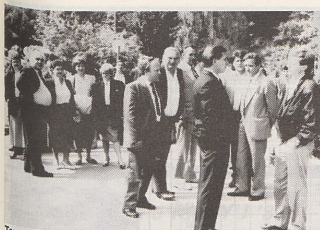
Trgovci iz Zagreba med ogledom naših tovarn

O tem so člane aktiva obvestili s predhodno objavo v Informatorju, kjer so lani objavili tudi program dela aktiva in društva invalidov.