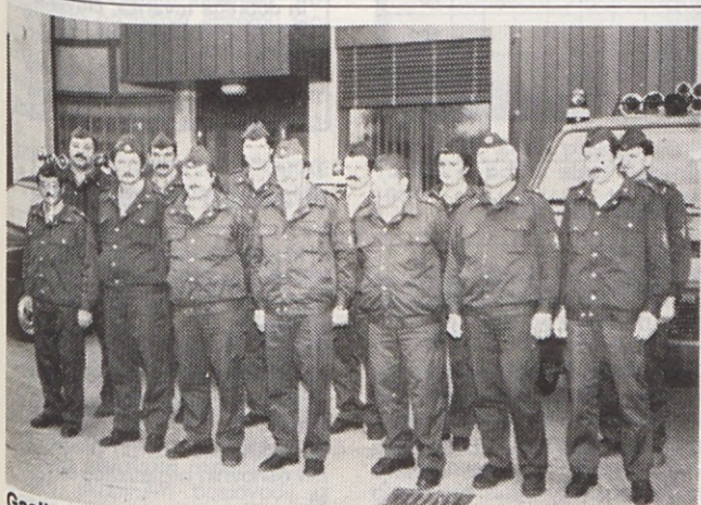
Gasilska enota Gorenja Servis – vselej v pripravljenosti

Bratov Mravljakov, katere pokrovitelj so, in delavce Jugobanke ekspoziture v Titovem Velenju, s katerimi že vrsto let uspešno sodelujejo. Obetajo si lepo vreme, predvsem pa dobro razpoloženje.