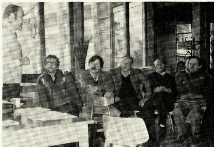
Cestno prometni predpisi so še vedno zanimivi

Prav gotovo je bilo to četrletje eno najtežjih, če ne najtežje v zadnjem obdobju. Vzroki za tako situacijo so poznani in so razpeti med »stabilizacijo« in vetrolomom.