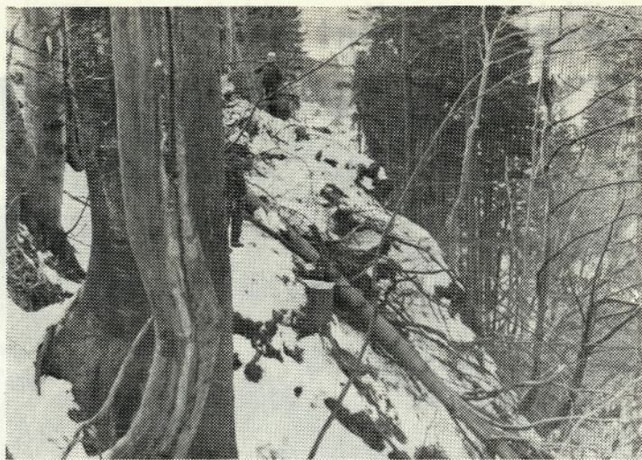
Trasa vodovoda poteka v ekstremni strmini