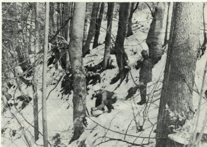
Pri poseku v strmini je varnost na prvem mestu