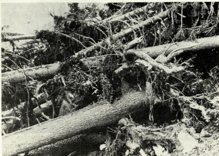
Vetrolom v Kranjski dolini

2. december. Zaspani glas napovedovalke v radiu je z monotonim glasom napovedoval vreme za ta dan. Nad Sredozemljem se zadržuje visok zračni pritisk, pri nas bo pretežno jasno in vetrovno.