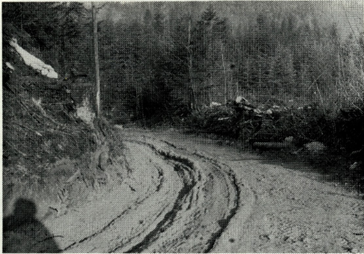
Posledice neugodnega vremena in težkih prevozov

Februarja meseca je naše gozdove prizadel katastrofalen veter. Takoj po ocenitvi škode se je začela akcija, da bi čimprej rešili podrt les pred gozdnimi škodljivci, ki se bodo pojavili ob toplejših dneh.