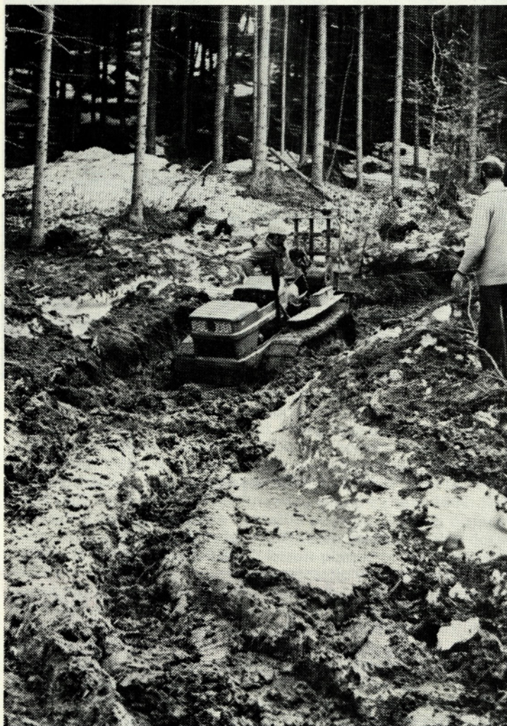
Mehak teren močno ovira spravilo lesa

Drugi katastrofalni val vetra, ki je 9. in 10. februarja napravil milijardno škodo v nižinskih gozdovih okrog Radovljice in Bleda, je Bohinju prizanesel. Zato smo že sredi meseca februarja poslali prve delavce v Grofijo. Z marcem pa smo tja preselili vse delavce in stroje.