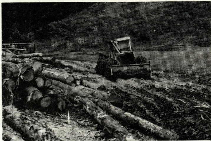
Tudi v ravnini so težki pogoji za spravilo

Po novi organizaciji TOZD in TOK so se razmerja v proizvodnji bistveno spremenila. TOK — delovna enota Jesenice ni prevzela nobenega gozdnega delavca. Tako je vso fizično delovno silo iz