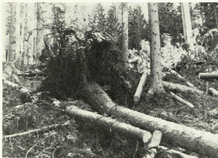
Pri izdelavi vetrolomov so včasih štori daljši