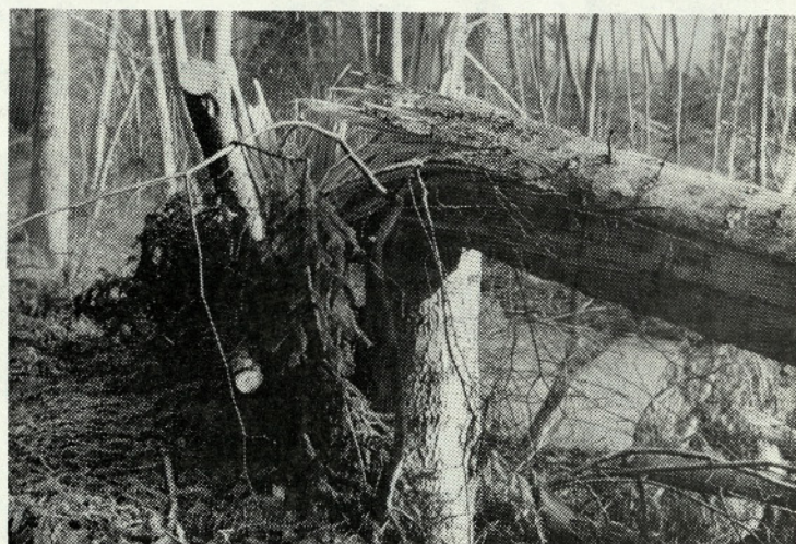
Silovita moč vetra

Telefon je »prima« zadeva. Sicer nekaj stane, povezan si s celim svetom. Če imaš sorodnike po svetu, si lahko z njimi v stiku kadarkoli. Neprijetno pa je, kadar telefon pozvoni takrat, kadar to najmanj pričakuješ in si najmanj želiš.