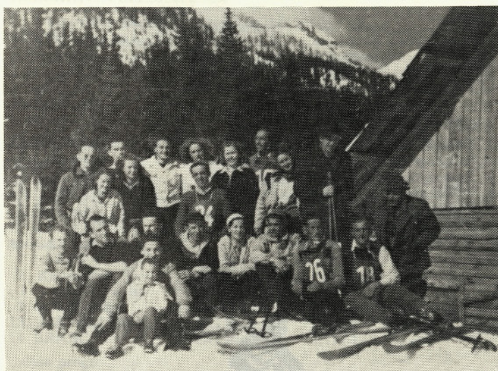
Udeleženci prvega smučarskega tekmovanja na Rudnem polju 1950

Na tem občnem zboru je bil izvoljen upravni odbor sindikalnega športnega društva Gozdar, in sicer: