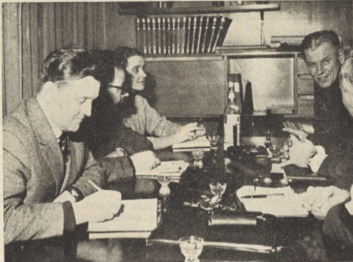
▲ Med letošnjimi razgovori o dodelitvi deviz Savi. Razgovore s vodili predstavniku Jugobanke — filijala Ljubljana in vodilni delavci Save

V večmesečnih razpravah je bilo izdelanih nekoliko predlogov za nov devizni režim — vendar sta končno obstala dva koncepta. Prvi predlog so izdelale v sodelovanju gospodarske zbornice iz Beograda, Zagreba in Sarajeva. Na osnovno vprašanje, kdo naj razpolaga z deviznimi sredstvi, odgovarjajo: »Gospodarske organizacije prosto razpolagajo z deviznimi sredstvi, ki so jih ustvarile z lastno gospo-