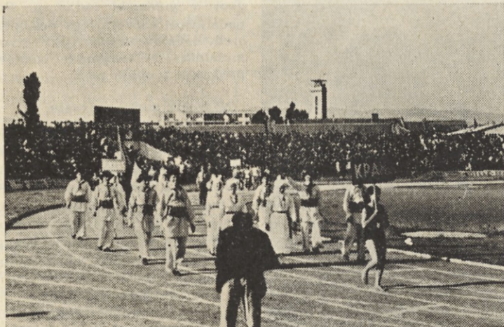
▲ Več deset tisoč gledalcev nas je toplo pozdravljalo, ko smo se prvič predstavili na mestnem stadionu

Kljub slabemu vremenu smo si ogledali nekaj znamenitosti tega velikega mesta. Ena izmed njih je Čele kula, v katere stene so nadaljevanje na 4. strani